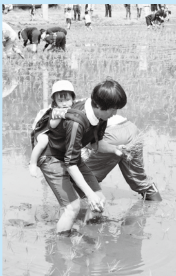
田植えをする参加者