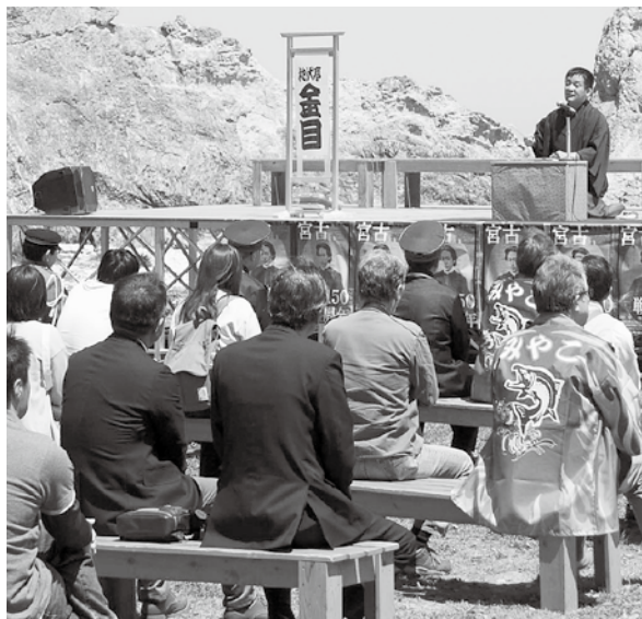
昨年は、宮古港海戦特別イベントなどで盛り上がりました