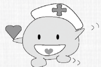
岩手県献血マスコットキャラクター「ココロンちゃん」