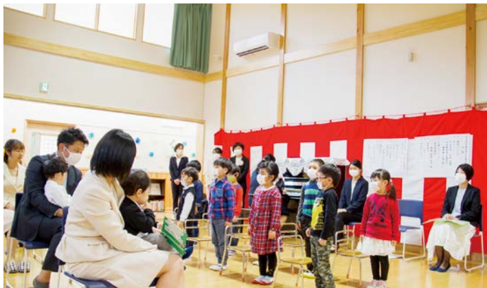
歌で、新入児童を迎える年長の子どもたち