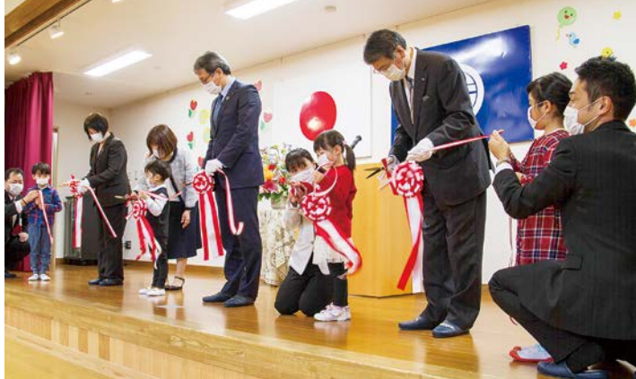
開所式では、子どもたちもテープカットを行い、開所を喜びました