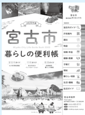
宮古市暮らしの便利帳イメージ

■問い合わせ 宮古警察署（☎64-0110）、市消費生活センター（☎68-9081）