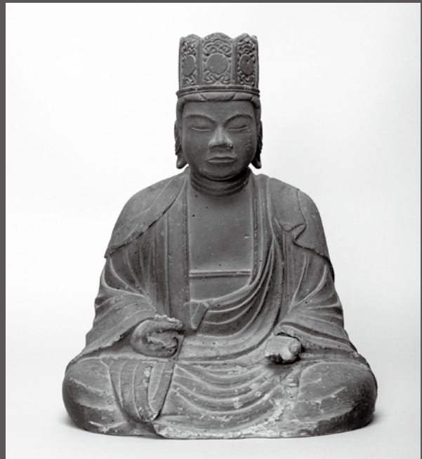
岩手県指定文化財となった長根寺の木造虚空蔵菩薩坐像

この頃の文化財では、本市腹帯に1396（応永3）年の応永石塔婆碑（市指定文化財）があり、禅宗で最も重要な釈迦の言葉が刻まれています。この像は、正法寺（奥州市）などの釈迦如来坐像（県指定）とも特徴が似ており、室町時代前期に宮古地方にも禅宗が伝わったことをうかがわせます。岩手県域の歴史文化を知る上で貴重な存在として評価されました。