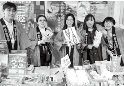
協力して宮古のPRに励む地域おこし協力隊メンバー（岩手わかすフェスにて）

それぞれの出店ブースには、著名な方にもおいでいただき、「瓶ドーン」など新名物なども紹介することができました。また、岩手を盛り