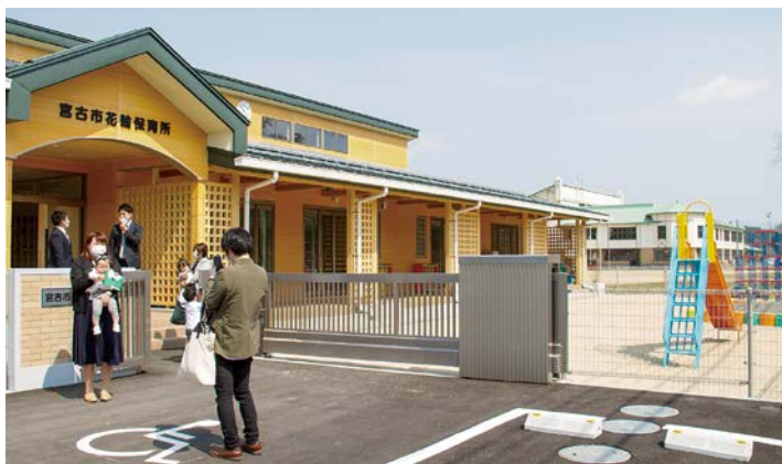
真新しい保育所を前に笑顔で記念撮影をする保護者