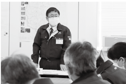
庁内の新型コロナ対策の会議で指揮を執る山本市長

宮古市として、市民の皆さんの暮らしをしっかりと支えてまいります。今は我慢の時です。ご理解いただき、市民一丸となり感染予防に取り組んで生活してまいります。