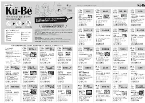
市内飲食店でテイクアウトを行っている事業者のチラシ（産業支援センターで配布しています）