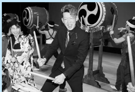
昨年度の成人式の様子