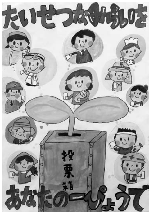
昨年度の県審査で入賞した作品