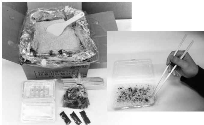
アルファ米炊き出しセット（左） 電子レンジで温めても食べることができます