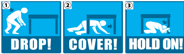
発生時の安全確保行動1-2-3 (Drop, Cover, and Hold On)

■自主参加型行動訓練(シェイクアウト)に取り組みましょう シェイクアウトとは、地震が到達する前に身の安全を確保することを考え行動する訓練です。緊急地震速報の試験放送に合わせて取り組みましょう。