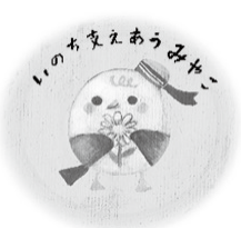
うみねこのみゃーさん (啓発キャラクター)