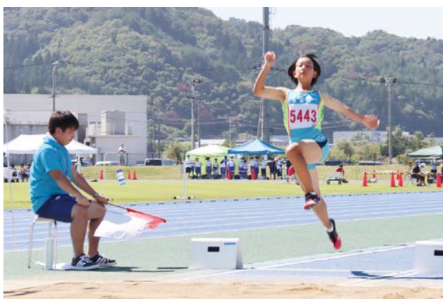
共通女子走り幅跳び。できる限り遠くへ