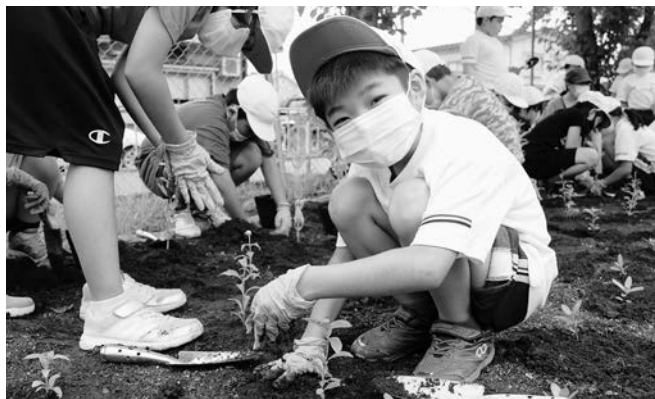
育てた花で、まちが明るくきれいになるといいね