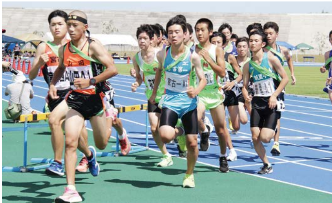
少しでも速く仲間の元へと駆ける選手たち