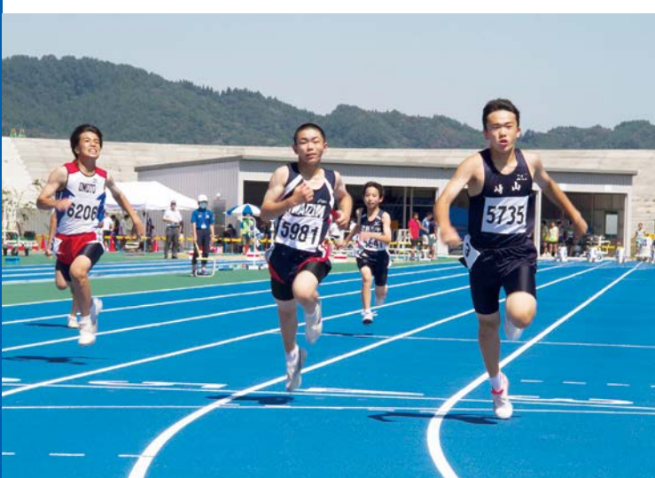
中学1年男子100m。最後まで諦めず全力疾走しました