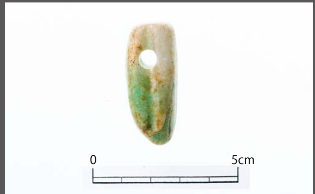
重茂館遺跡群から出土したヒスイ 装飾品として作られた完形品です。

縄文時代に今の新潟県から遠路を経て重茂に持ち込まれたヒスイは、縄文時代にあっても広域での交流があったことを知る大変貴重な資料です。