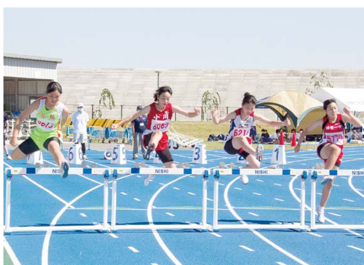
共通女子100mハードル。障害物を物ともせず駆け抜けました