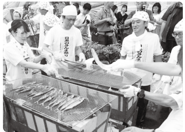
目黒のさんま祭りは毎年大勢の来場者でにぎわいます

古典落語「目黒のさんま」にちなんだ目黒のさんま祭りは、目黒駅前活性化を図るため、目黒駅前商店街振興組合の青年部が主体となり平成8