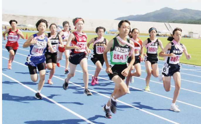
女子の部のスタート。必ず1番でチームメートに鞭を渡そうと気迫あふれる走りを見せました