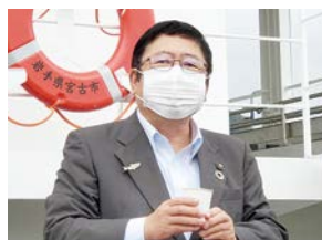
出港を祝い乾杯の音頭をとる山本市長（9月1日）