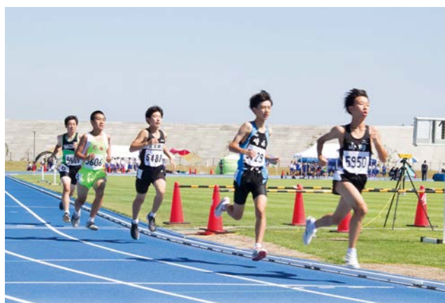
共通男子800m。2周目、これから勝負と気合いを入れます