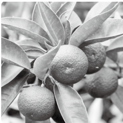
神山町特産のスタヂ

人口=5,147人 世帯数=2,458世帯 面積=173.30平方キロメートル ※令和2年9月1日現在