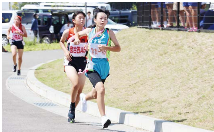
前の選手まであともう少し。追いつけ、追い越せと各選手が奮闘しました