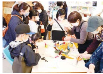
手芸のワークショップ