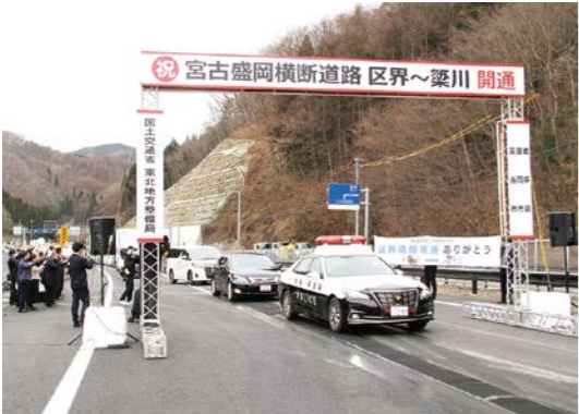
宮古盛岡横断道路区界道路の開通の様子