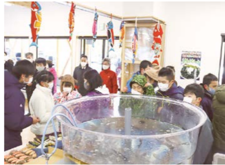
セレモニー当日には水槽が設置されました