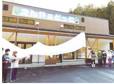
愛称がお披露目されました

重茂への道路が整備されたこともあり、スムーズに着くことができました。新鮮な海産物が食べられるので市内の方はもとより、市外の方にもオススメです！ (体験予約・お問い合わせは ☎68-2301 宮古市重茂水産体験交流館(重茂漁業協同組合)まで)