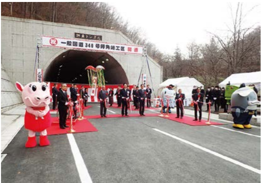
開通式でのテープカットの様子