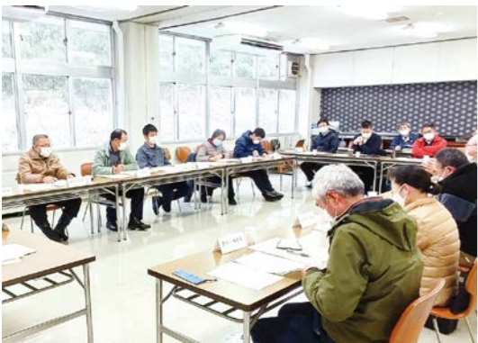
地域づくり協議会会議の様子