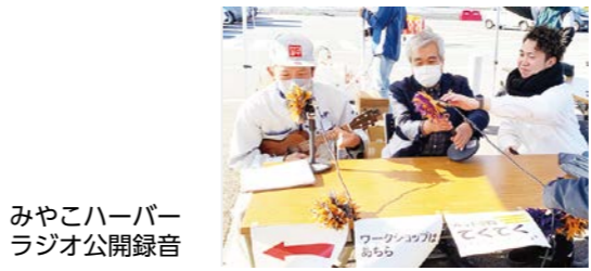
みやこハーバーラジオ公開収録