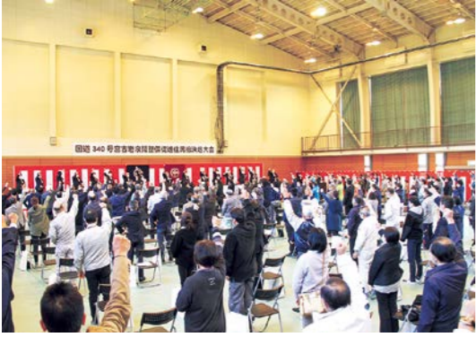
国道340号の整備促進に向けて団結する参加者