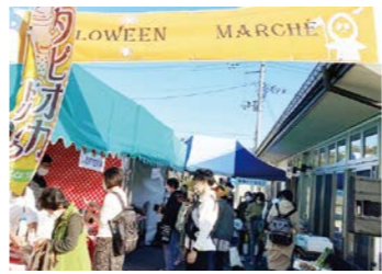
タロウィンマルシェ