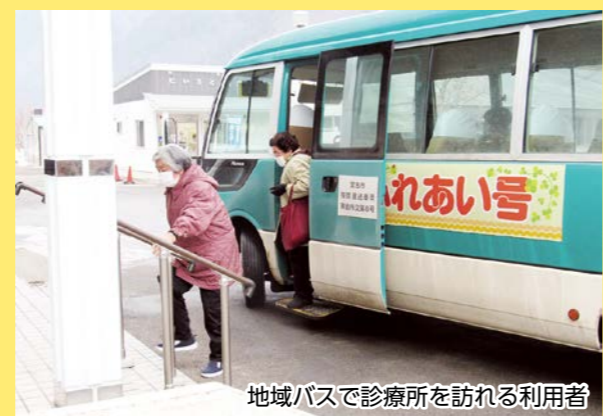
地域バスで診療所を訪れる利用者

利用しやすい地域バスに 地域バスはマイクロバス（和井内線・刈屋線）とワゴン車（臺目線・腹帯循環線）の2台で運行しています。 利用しやすい運行を目的に停留所以外でも乗り降り可能なフリー乗降区間も設定されました。 また、希望者には、乗り降りに便利なバス停を記載した「マイ時刻表」を作成しています。詳しくは新里総合事務所へお問い合わせください。（☎72-2111）