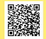
新里地域バス ▲「ふれあい号」運行のお知らせ