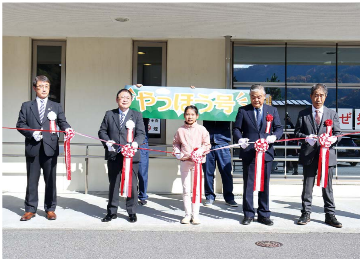
セレモニーでのテープカットの様子