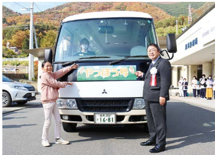
やっほう号のステッカー貼付の様子