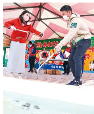
あわびとりに挑む参加者