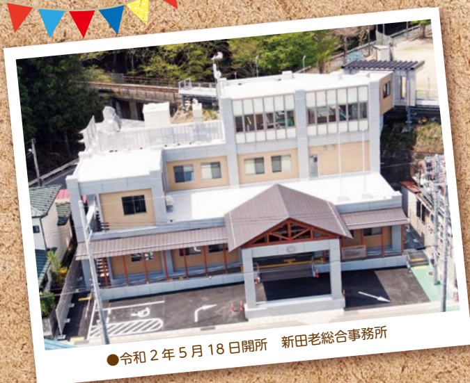
●令和2年5月18日開所 新田老総合事務所