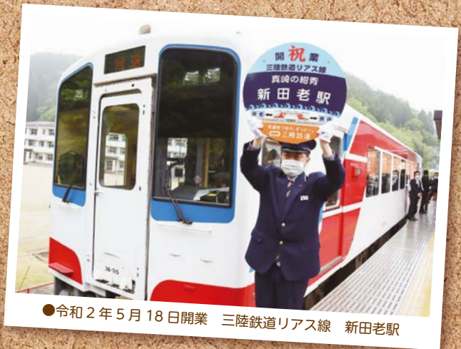
●令和2年5月18日開業 三陸鉄道リアス線 新田老駅