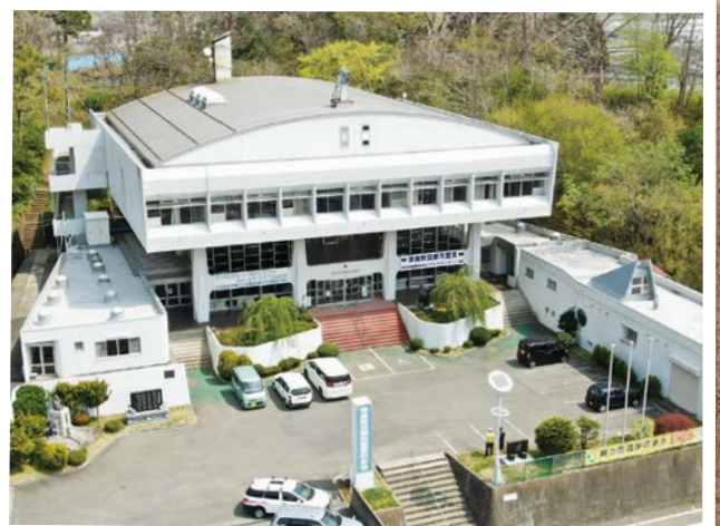
●旧田老総合事務所