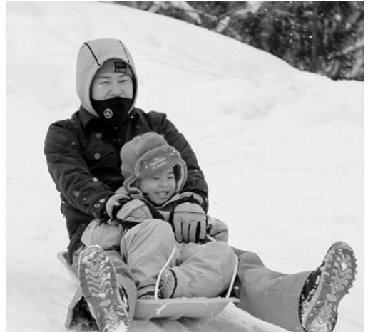
区界高原でおもいっきり体を動かして、冬を満喫しましょう！(写真は昨年の様子)

■問い合わせ 川井産業振興公社(☎65-7735、FAX65-7736、✉kawai-co@rnac.ne.jp)