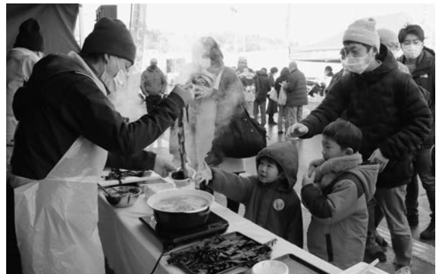
肉厚の「春いちばん」を、ぜひ会場で味わってください！