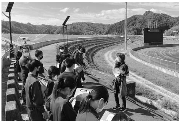
ジオパーク出前授業で田老の「学ぶ防災」ガイドから震災の教訓と復興を学ぶ中学生の様子

本市を含む三陸沿岸市町村で構成される「三陸ジオパーク」は、平成25年に日本ジオパークに初めて認定されました。地球の活動と人の関わりを楽しむことができ、貴重な地質や地形が守られ、地域振興のために活動している地域がジオパークとして認められています。 ジオパークは、その活動について定期的に日本ジオパーク委員会の審査を受けます。 令和5年12月、三陸ジオパークは、災害伝承の取り組みなどが評価され「再認定」となりました。