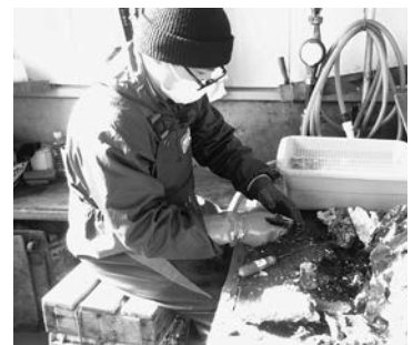
カキの殻むき体験の様子