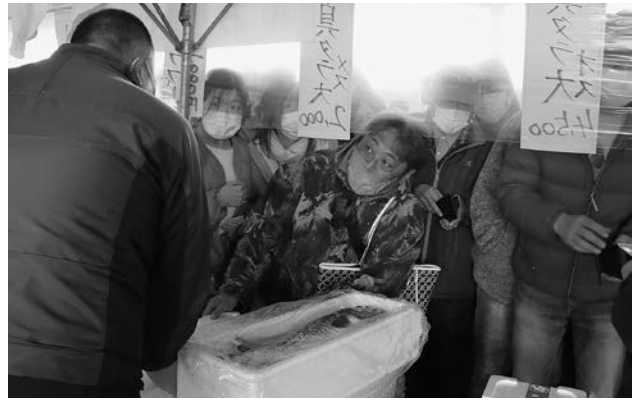
マダラの鮮魚や加工品などは売り切れ必至！早めにお買い求めを！