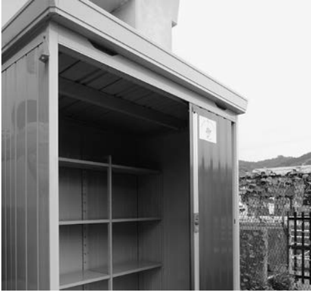
上（物置）下（アルミスロープ）などを整備