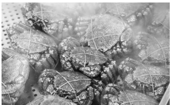
今が旬！身が締まった絶品の毛ガニです