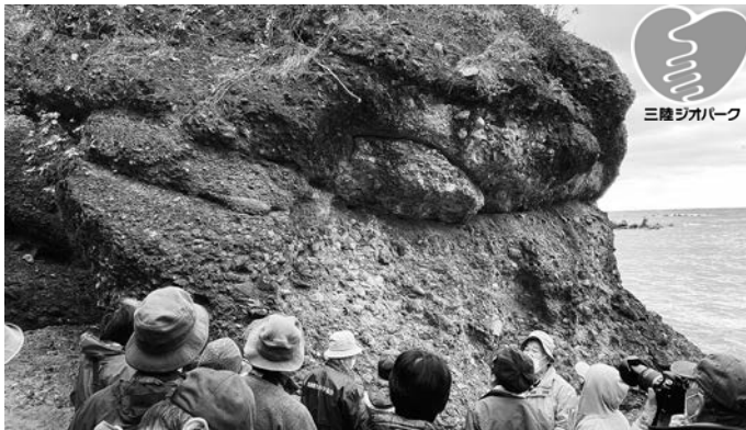
断層などを観察します(写真は令和4年度の様子)