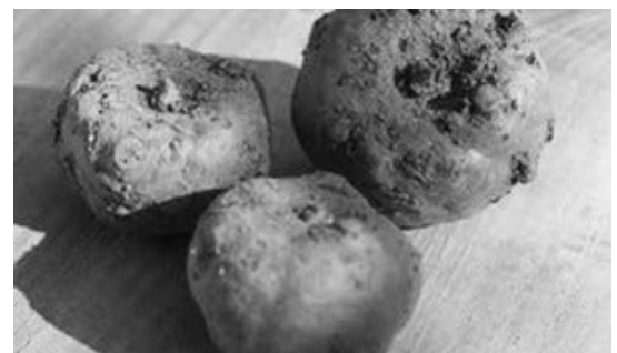
こんにゃく芋を調理していくと...