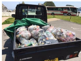
2017～2018年の春と夏に 行ったクリーン作戦の様子。 園地内を歩いて清掃やごみ 拾いを行います。