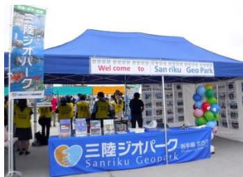
ジオコーナーはさらにパワーアップしてお出迎えます！