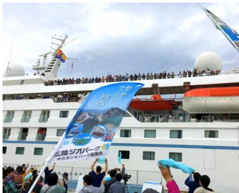
5月8日(水) スターレジェンド/9,975トン

昨年の「スターレジェンド」のお見送りの様子。今年もみんなと一緒に盛り上げましょう！