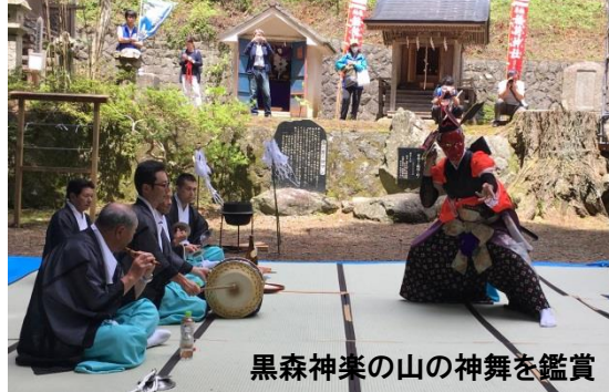
黒森神楽の山の神舞を鑑賞