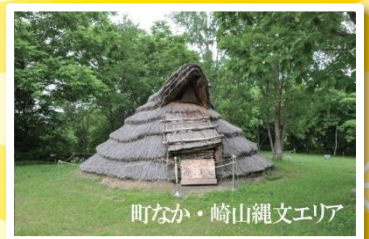
町なか・崎山縄文エリア