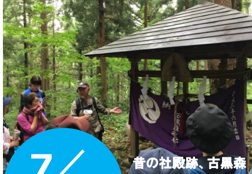
昔の社殿跡、古黒森