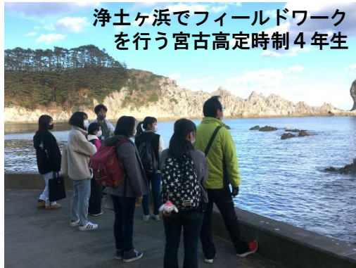
浄土ヶ浜でフィールドワークを行う宮古高定時制4年生

三王岩と周辺の地層を解説。50mといわれる男岩の本当の高さが発表されると、参加者からは驚きの声が上がりました。