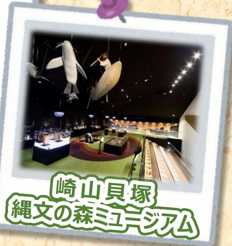
崎山貝塚 縄文の森ミュージアム

開館時間：9:00～17:00 ※月曜休、12/28～1/4休 入館料：高校生以下無料、 大人200円、学生150円 ☎0193-65-7526 宮古市崎山第1地割16番地1