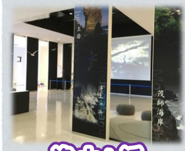
浄土ヶ浜 ビジターセンター

開催：12/26～28、1/5～11の 10:00～11:30と13:30～15:00 参加料：500円