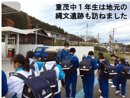
重茂中1年生は地元の縄文遺跡も訪ねました