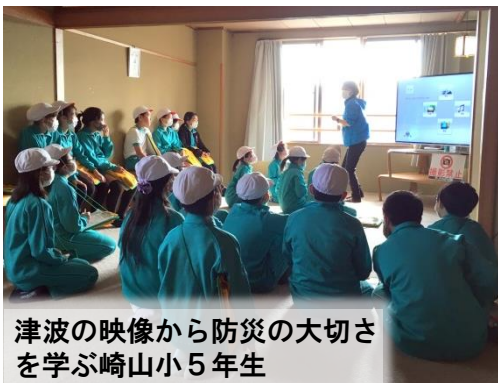
津波の映像から防災の大切さを学ぶ崎山小5年生