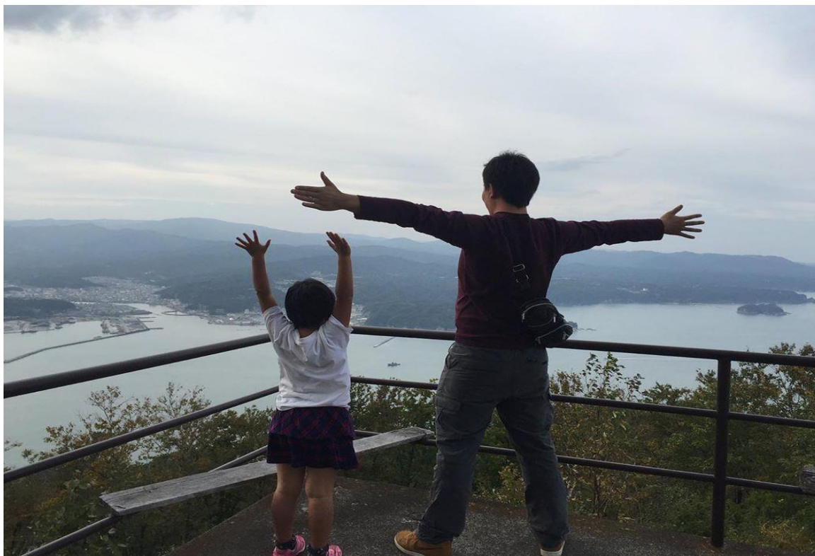
月山からこんなに見えるんだよ