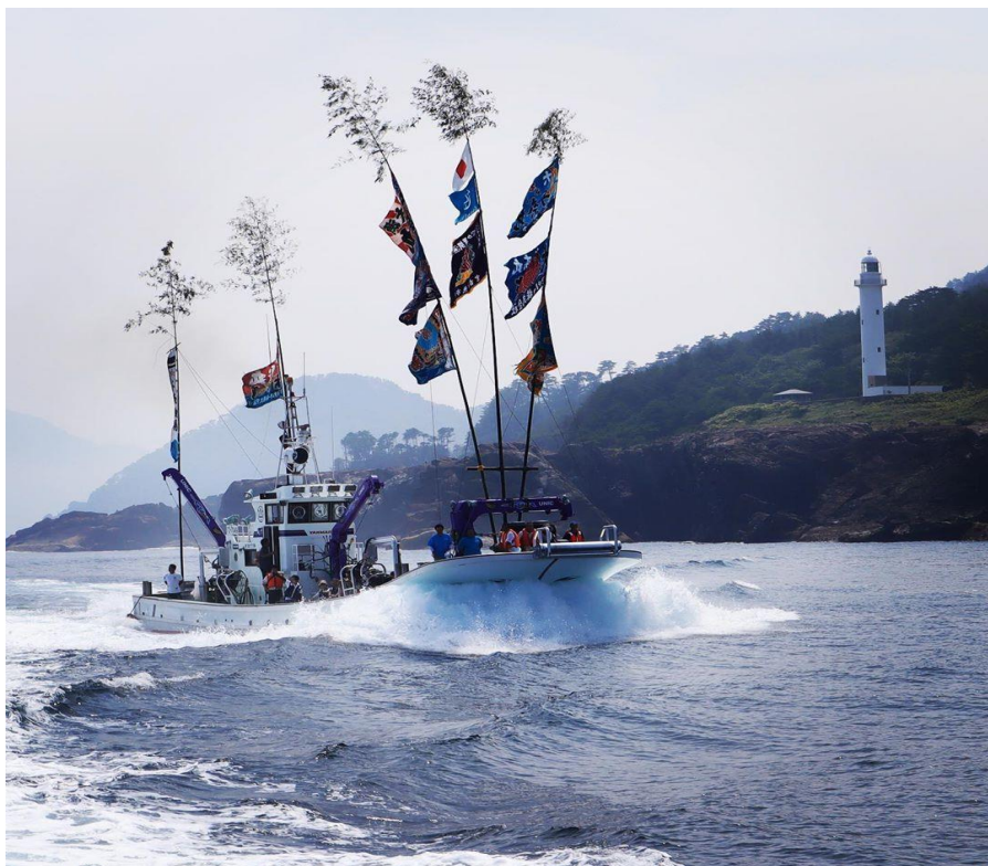
the重茂半島 与奈丸と鮎ヶ崎灯台