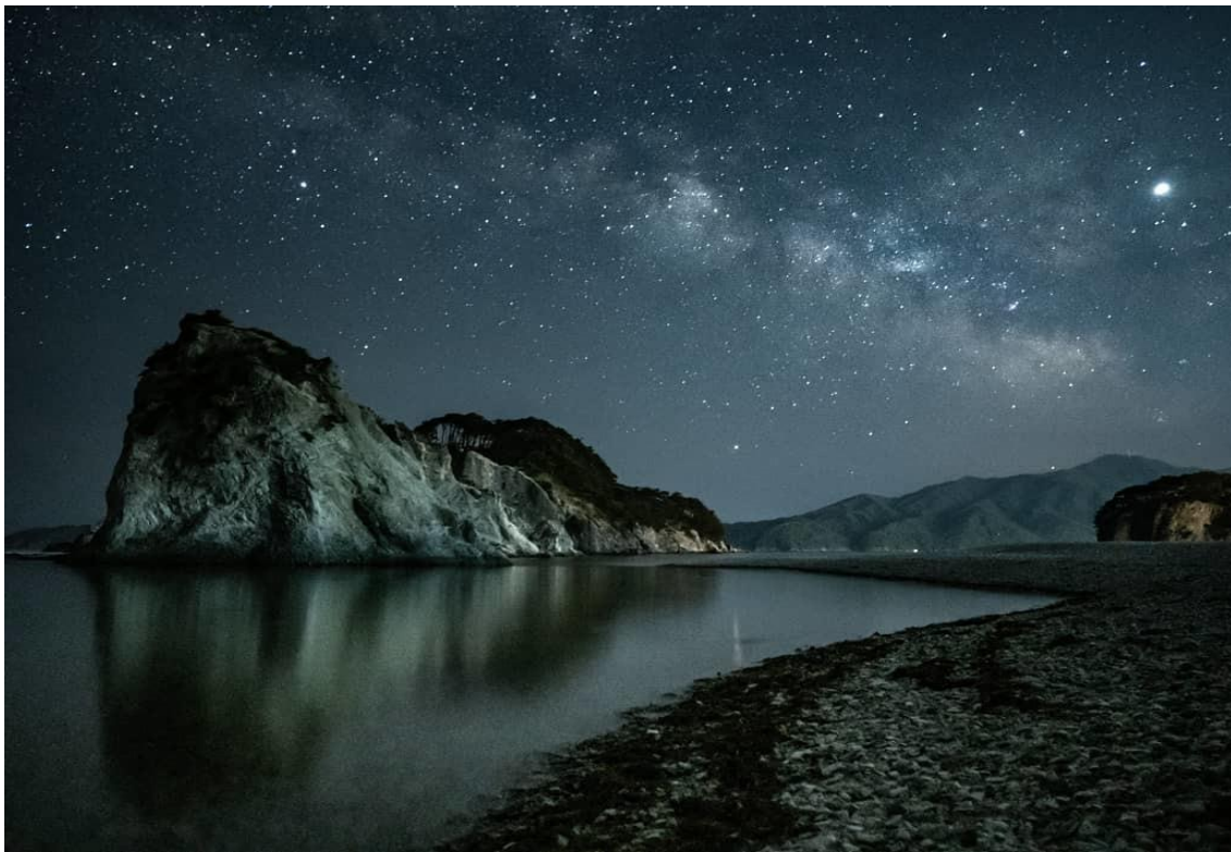
浄土ヶ浜と天の川