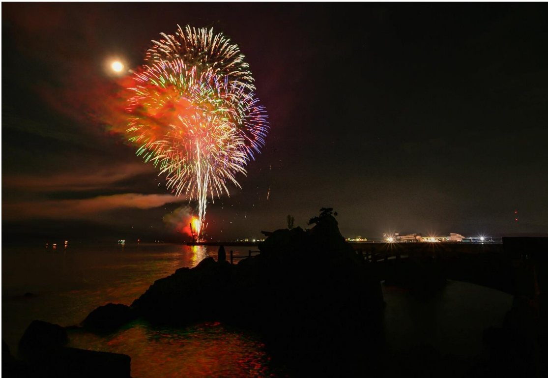
宮古夏祭り海上花火大会2019