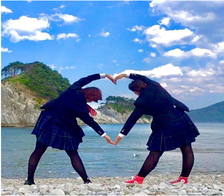
制服で浄土ヶ浜 青春