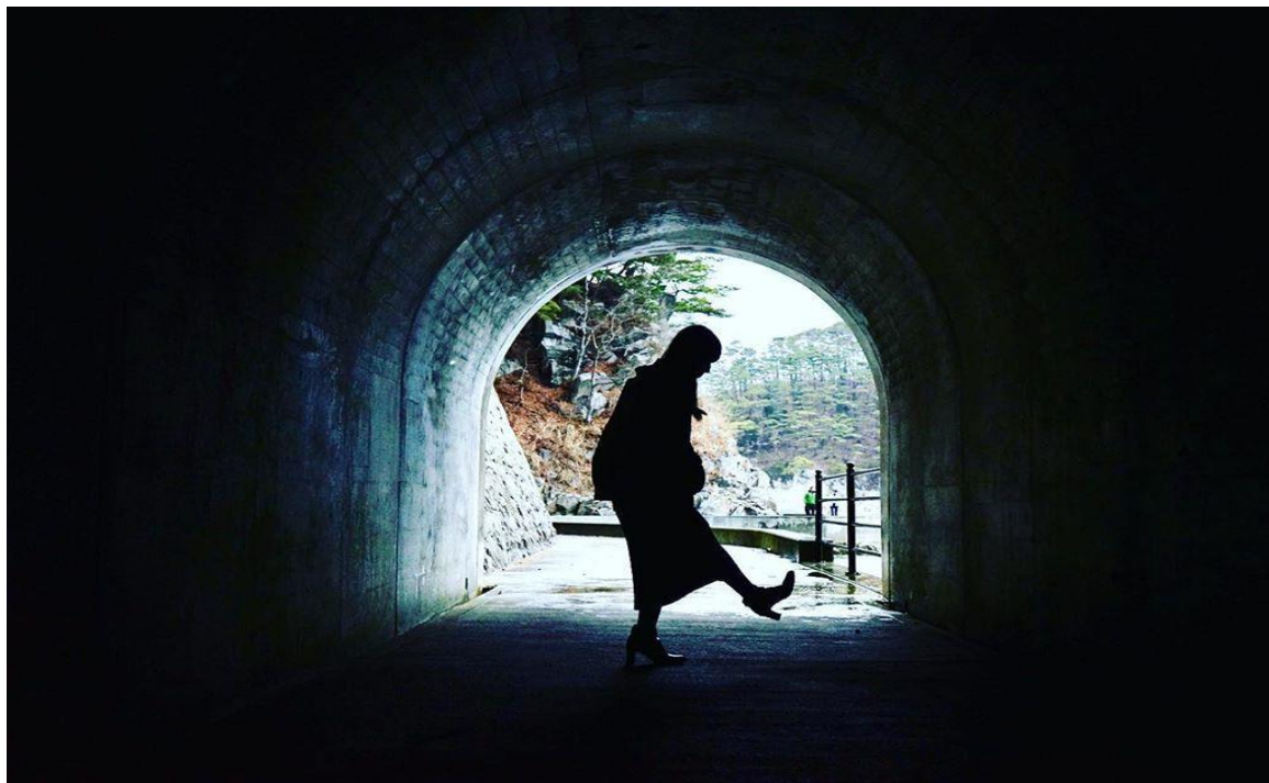
見所は海だけじゃない