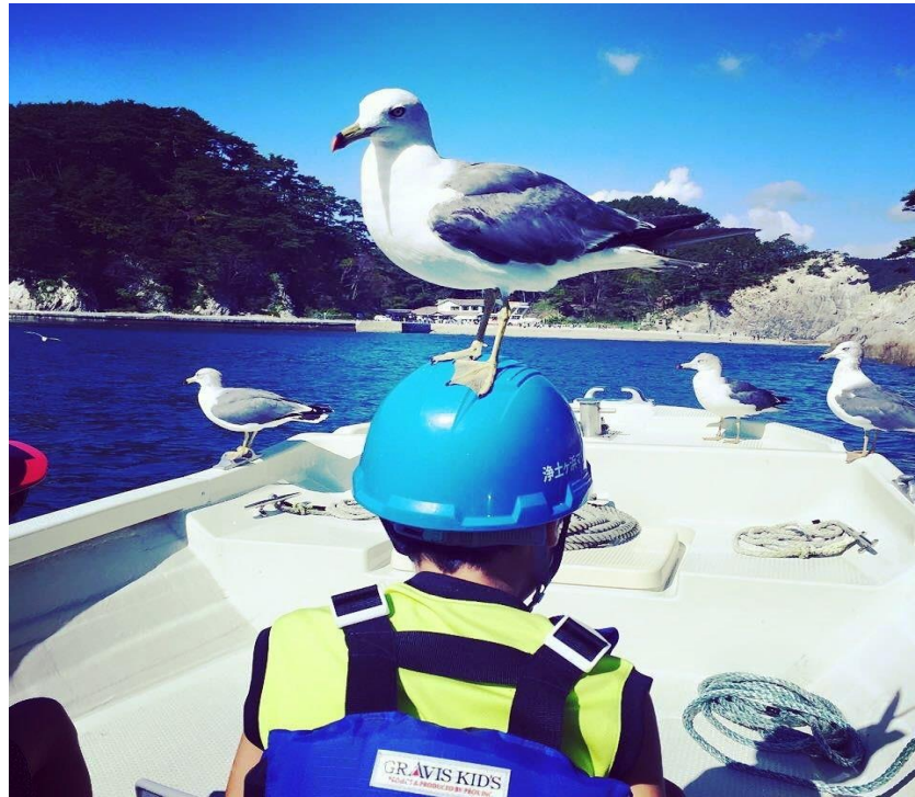
ウミネコとサツパ船