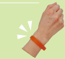
▲認知症サポーターの証 オレンジリング

認知症サポーターは、認知症について正しく理解し、認知症の人や家族を温かく見守る応援者です。認知症サポーター養成講座は、地域の自治会や団体の会合、学校などで開催しています。