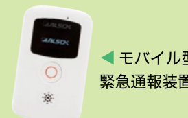
◀モバイル型緊急通報装置