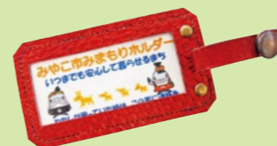
▲みまもりホルダー

“反射材”がグッズとして配られます。事前に本人の情報を登録することで、すみやかな検索と早期発見へとつながります。