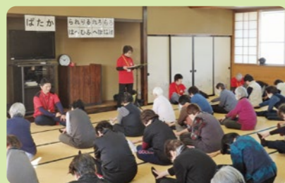
▲例：シルバーリハビリ体操教室

身近な場所に気軽に集まることのできる場を設け、世話人（地区住民）協力のもと、皆さんが体操やレクリエーション等を通して心身機能の低下防止や交流を図っています。また、地域での自主的な活動へとつながっています。