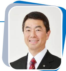
宮城県知事 村井 嘉浩 (むらい よしひろ)

内閣府特命担当大臣（沖縄及び北方対策、消費者及び食品安全、地方創生、アイヌ施策）、国際博覧会担当大臣。認定内科医、小児科専門医。