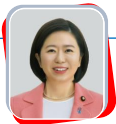
国際博覧会担当大臣 自見 はなこ (じみ はなこ)

内閣府特命担当大臣（沖縄及び北方対策、消費者及び食品安全、地方創生、アイヌ施策）、国際博覧会担当大臣。認定内科医、小児科専門医。