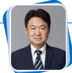
内閣官房国際博覧会推進本部事務局次長 井上 学 (いのうえ まなぶ)

札幌市生まれ。博覧会や展示会を数多く手掛け、2005年愛知万博ではチーフプロデューサー補佐として基本計画策定に従事、ロボットプロジェクト、愛・地球広場、極小IC入場券をプロデュース。