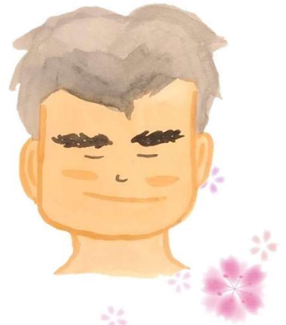
笹原さんが被災地での活動の記録を記した絵日記作品

「とうちゃん！」 6才の息さんの声。 大きく 安置所へ びびいたね...。 お父さんは いつも あなたの傍にいる。 忘れな ね” いてあげてね。