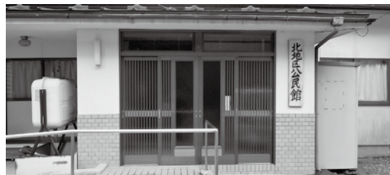
自治会などが管理・運営する集会施設