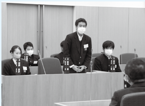
熱い議論を交わす高校生たちの姿をぜひ議場でご覧ください。(写真は去年の様子)

傍聴しませんか？ みやこ未来議会2021 宮古市の未来を担う高校生が議員となり、地域の課題を自由な発想や視点で捉え、自らの考えを提言します。高校生の熱い思いを議場で感じてみませんか？ ■日時 11月3日(水)午後1時～5時(予定) ■場所 市議会議場傍聴席(市役所5階) ■定員 20人程度(定員を超えた場合は、イーストピアみやこ2階多目的ホールの中継放送会場のご案内します) ■問い合わせ 陸中宮古青年会議所・小野寺(☎080・2842・9780)