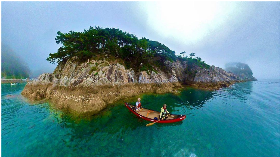
さながら極楽浄土のごとし 67 票