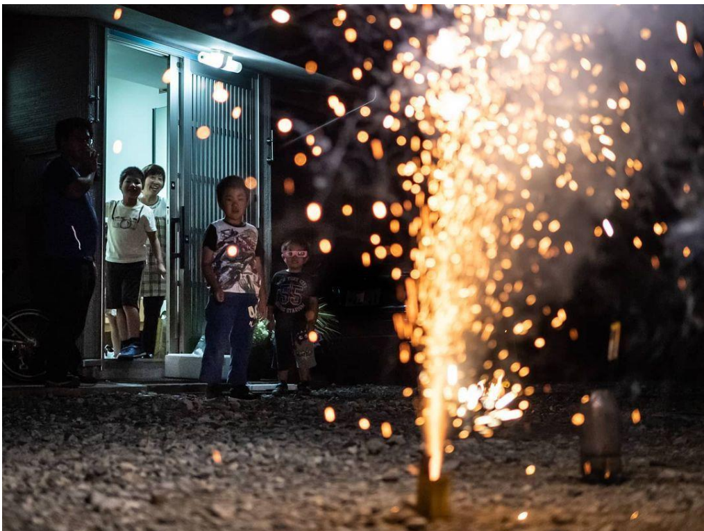
松明かしのフィナーレ 27 票