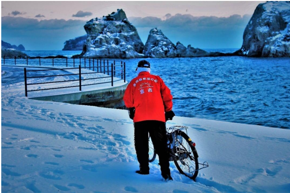
本州最東端の街 75 票