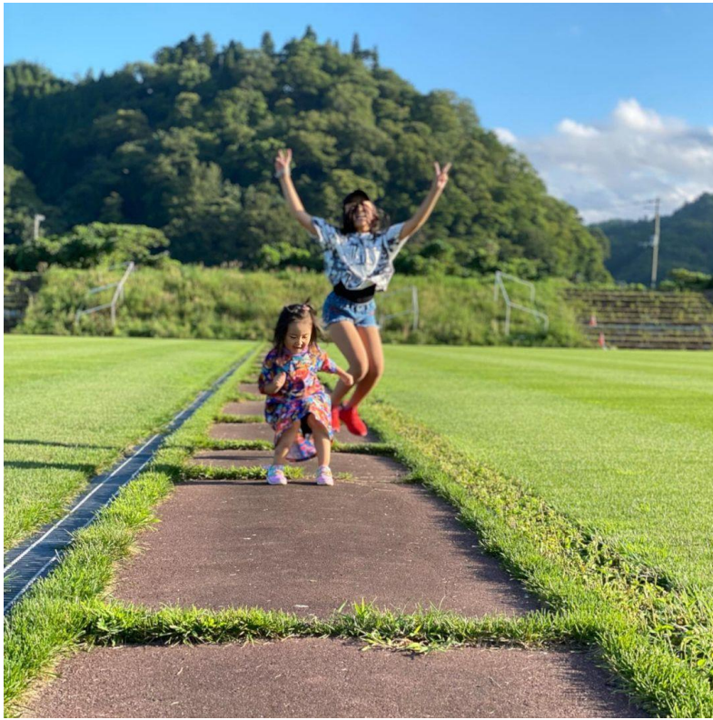
大きくジャンプ 40 票