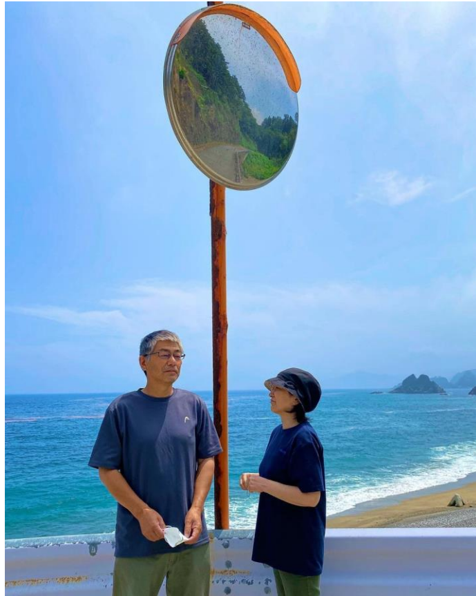
夫婦を超えてゆけ 13 票