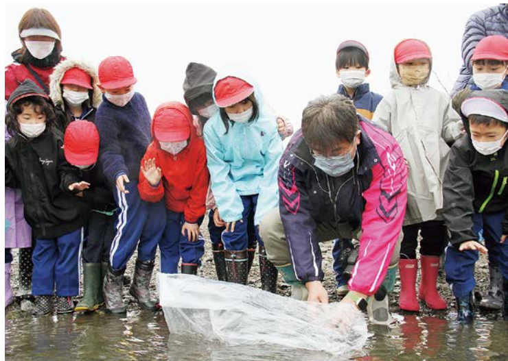
学校で育てた稚魚に手を振り「行ってらっしゃい」と声を掛けながら見送る児童