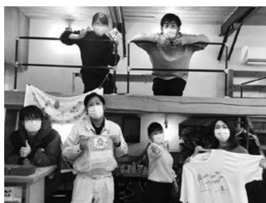
これから、仲間たちと一緒にアクティブな活動を展開していきます！

の目標です。そのために、SNSなどで、宮古にいるからこそ分かる情報を届け、魅力を再発見できるきっかけを作っていきます。宮古市のために、これから精一杯頑張ります！