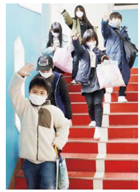
新しい出会いに期待を膨らませる児童ら