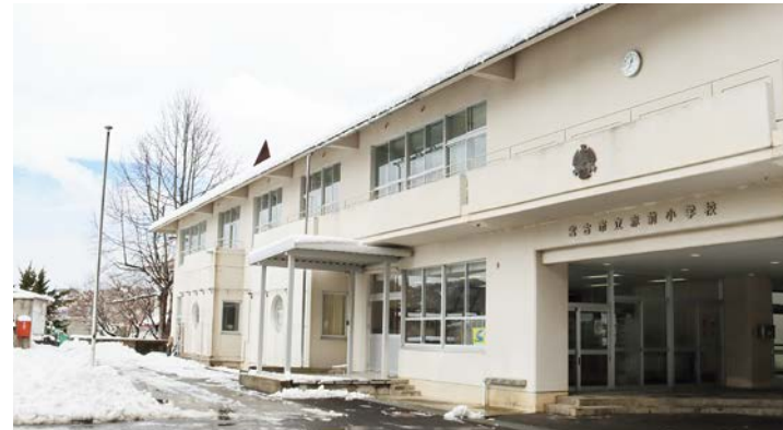
思い出、そして感謝がいっぱい詰まった学び舎。今までも、そしてこれからも地域の人々の胸に生き続けます

母校への別れと後輩たちへのエールを送りました。 また、式典後に開催された思い出を語る会では、全校児童による呼びかけや合唱などの映像が披露されました。参加者は、学校生活を懐かしみながら、最後の別れを惜しみました。 同校は、1876年（明治9年）に創立。以降、145年という長い歴史の中で、延べ1351人も卒業生を送り出してきました。 赤前地区を見守り、そして愛され続けた赤前小学校。4月から、津軽石小学校に統合しました。