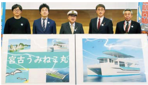
3月15日に行われた遊覧船船名発表会（市長は写真中央）

遊覧船は、5月2日(月)に工場のある山田町で進水式を行い、試運転などを経て、7月17日(日)から就航する予定です。宮古の海の新たなにぎわいスポットの誕生に、今年例年以上に夏を待ち遠しく思っています。