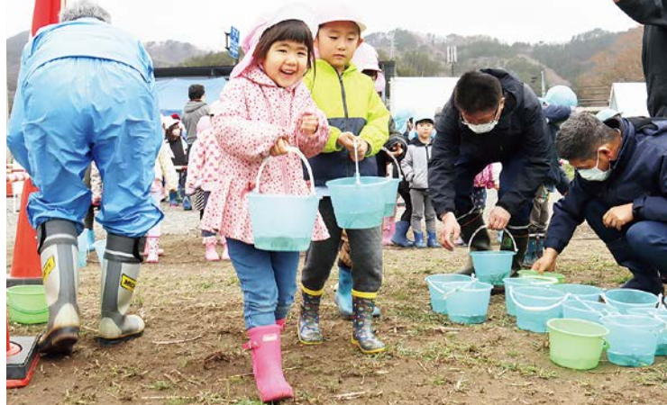
鮭の稚魚を受け取り、ワクワクした様子で放流に向かう園児