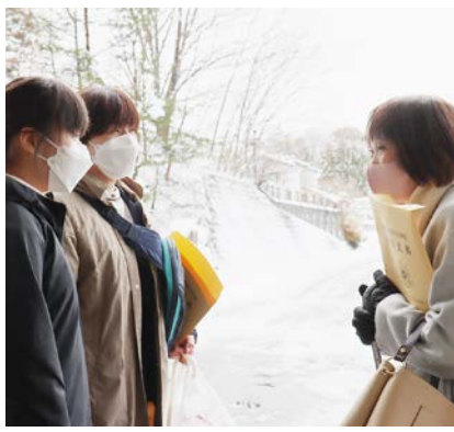
母校での久しぶりの再会。思い出話に花が咲きます