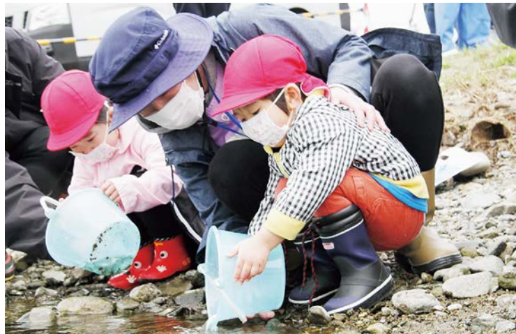
先生と一緒に丁寧に稚魚を放流しました