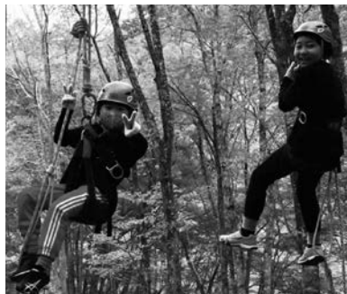
みんなで楽しく遊びましょう