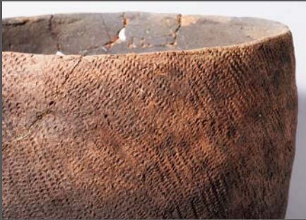
「縄文」がびっしりつけられた縄文土器（拝殿峠遺跡出土）

崎山貝塚縄文の森ミュージアムでは、縄文土器の「模様」をテーマに、令和4年度テーマ展「宮古の縄文土器もよう」を開催しています。宮古市出土の縄文土器には、どんな模様があるのか、そして模様がどうやってつけているのか、などを紹介しています。縄文土器の名前の由来である「縄文」の模様が表面にびっしりつけられた土器や、貝殻 かいがら を使った模様 かいがらもん の施された土器、そしてさまざまな形と方法で描かれている「渦巻文 うずまきもん 」の施された土器などを展示しています。また、縄文土器の模様を調べることで分かる、縄文時代における地域を超えた縄文人の広いつながりも紹介しています。 教科書などでも見たことのある縄文土器を、近くでじっくりと見てみてはいかがでしょうか？