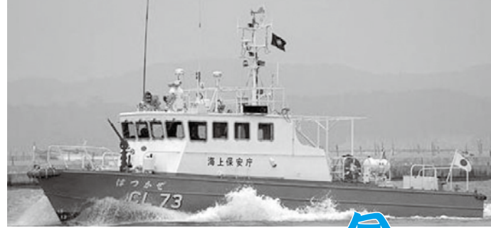
海上保安庁の巡視艇「はつかぜ」の展示も行います