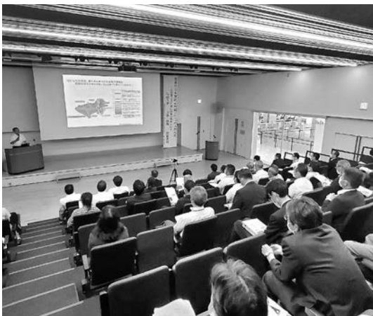
7月8日に開催された講演会の様子

講演会では「市内全域で連携し、持続可能な発展のためにどのように生活するかを主体的に考えることが大切。覚悟を持って市民と行政が一緒に将来像を描く必要がある。復興まちづくりに取り組んできた宮古市だからこそ、未来への『まち育て』に向かう絶好のタイミングだ」と、力強いエールをいただきました。 また、計画策定の進め方や概要を市民の皆さまに広く周知するため、7月20日から31日にかけて、市内8会場で9回の市民説明会を開催。計50人にご参加いただきました。