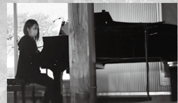
ピアノの演奏を聴きながらゆったりとした時間を過ごしませんか?