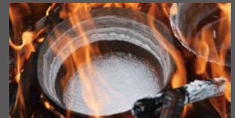
テレビの企画で塩作りを再現している様子