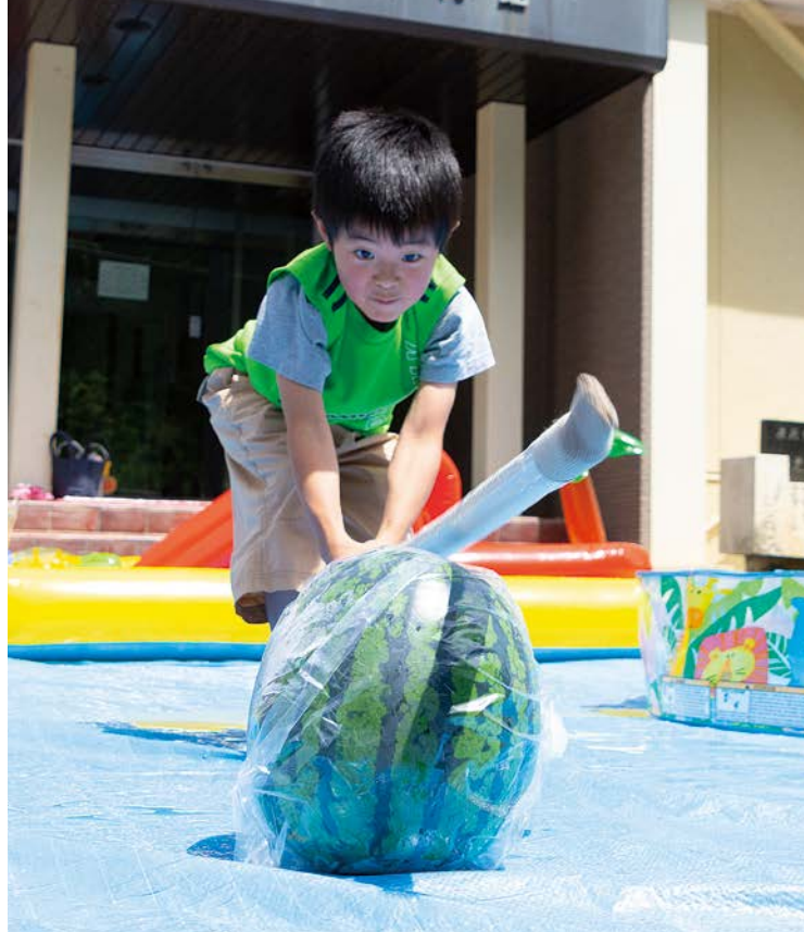
真剣な表情でスイカ割りにチャレンジ！何回か挑戦し、無事にスイカを割ることができました