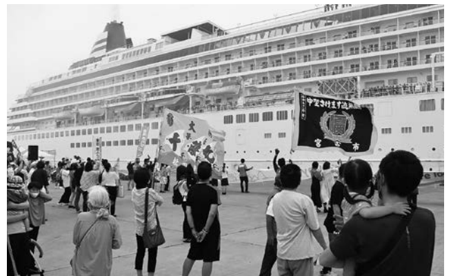
またの寄港を願い、多くの市民がお見送りしました