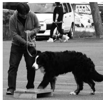
愛犬と一緒に運動しませんか？