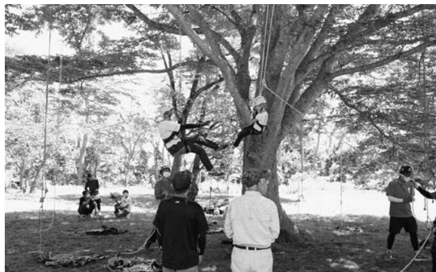
約3mの高さにあるブランコで自然を堪能する参加者