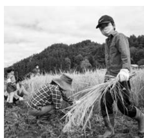
気持ちよく汗を流しながら、金色に輝く稲をみんなで楽しく収穫しましょう！

■申し込み方法 電話 ■申込期限 9月16日(金) ■申し込み 市農林課農政係(☎9094) ※新型コロナウイルス感染症の拡大状況によっては、中止とする場合があります