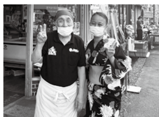
商店街の店主さんたちは気さくで、すぐ仲良くなりました！

商店街を訪れる機会が少ない人に、日常的に楽しんでもらうためのきっかけ作りを行っています。ぜひお気軽に、中心市街地商店街へお立ち寄りください！