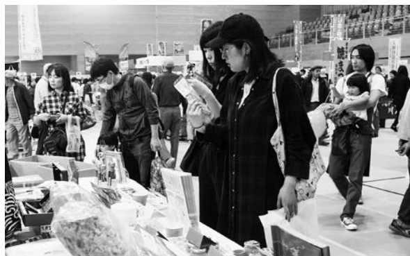
今年は、感染症対策を講じて屋内にもブースを展開する予定です(写真は令和元年開催時)

■日時 10月1日(土)・2日(日)午前10時～午後3時 ■場所 市民総合体育館 ■出店内容(予定) ▽地場産品や姉妹・友好交流都市などの特産品販売 ▽企業・学校・福祉施設などの展示 【「昼花火」】 10月1日(土)／閉伊川河川敷から打ち上げ ■問い合わせ 宮古市産業まつり実行委員会(市産業支援センター)内、☎(019)9092)