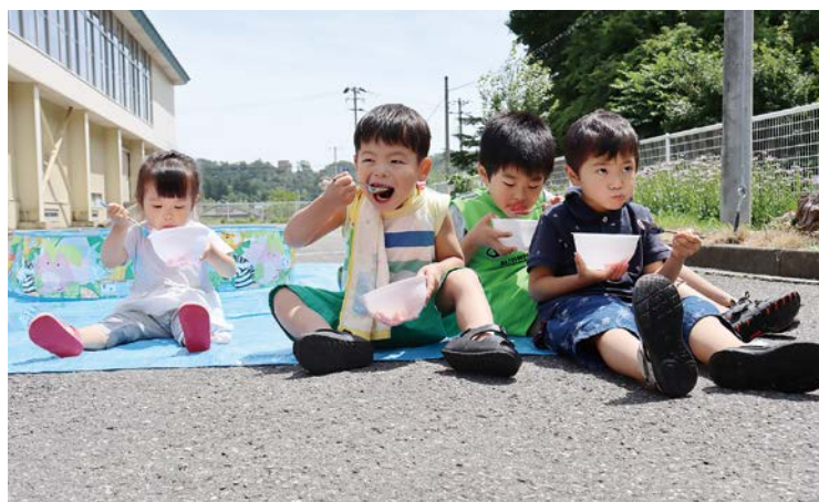
割ったスイカを夢中になって頬ばる子どもたち