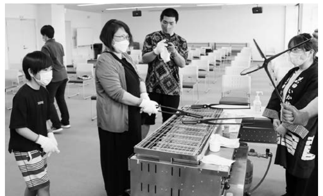
昔ながらの型を手に、せんべいを焼き上げます