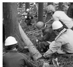
講師が丁寧に教えます

■申し込み 自伐型林業推進協会・三木(☎03-6550-8141)、市農林課林政係(☎68-9097)