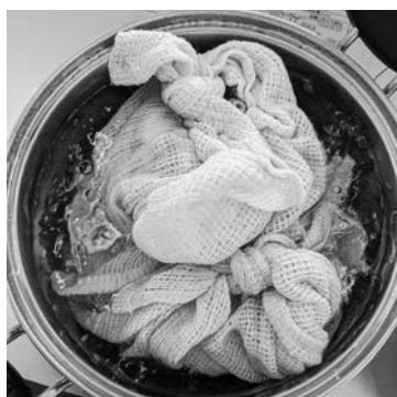
熱に強い市販のポリ袋に食材を入れて布で包み、ゆでるだけ!

コード)で申し込み ■申込受付開始日 9月1日(木)午前8時30分 ■申込期限 9月12日(月) ■申し込み 宮古保健センター (☎640111、FAX645464)