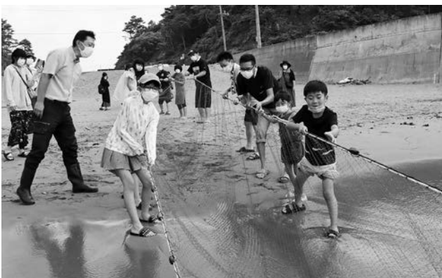
地引網の中にはどんな生き物があるかな？