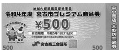
①中小商店・大型店共通券