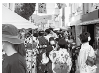
7月30日・31日に開催された夜市は、大盛況でした

内外の人に知ってもらうため「トコトコみやこな商店街」というインスタグラムアカウン