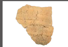
製塩土器（鎌ヶ崎館山貝塚：平安時代）

■日時 9月10日(土)・11日(日)午前10時～正午、午後1時～4時 ■会場 崎山貝塚縄文の森ミュージアム 体験広場