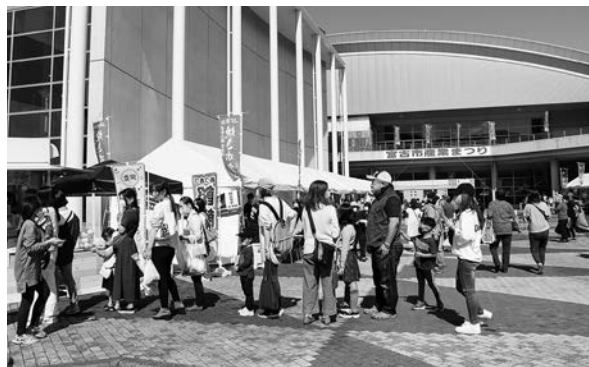
今年も、おいしいグルメなどを堪能できるブースが数多く出店します！

■日時 10月1日(土)・2日(日)午前10時～午後3時 ■場所 市民総合体育館 ■出店内容(予定) ▽地場産品や姉妹・友好交流都市などの特産品販売 ▽企業・学校・福祉施設などの展示 【「昼花火」】 10月1日(土)／閉伊川河川敷から打ち上げ ■問い合わせ 宮古市産業まつり実行委員会(市産業支援センター)内、☎(019)9092)