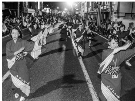
宮古の秋を代表するイベントが3年ぶりに！

■公開手踊り練習(日時/場所) 9月9日(金)午後7時/市民総合体育館 ■問い合わせ みやこ秋まつり実行委員会(☎65-9555)