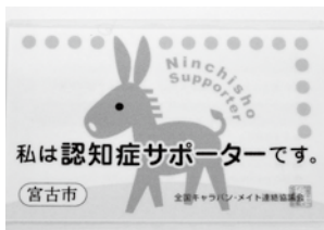
サポーターカード