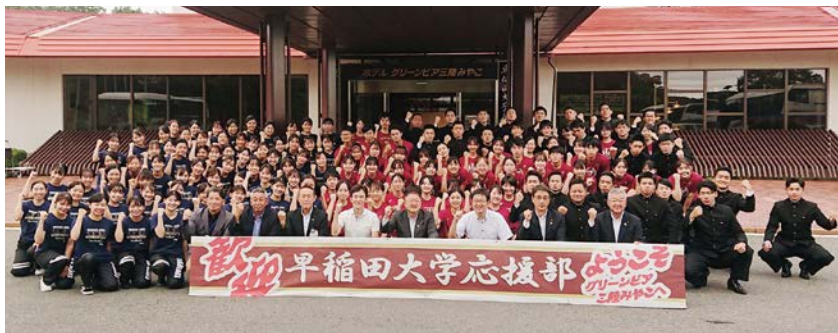
合宿を終えた早稲田大学応援部の皆さんとの記念写真

この日も宮古市は、早稲田大学応援部を「応援」していきます。ぜひまたお越しいただき、宮古の空に、あの力強い声を響かせてほしいと思います。