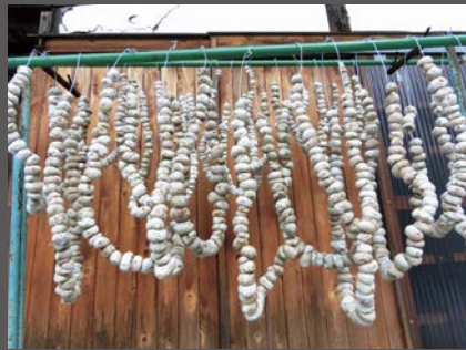
「凍みイモ」を干す様子

食材を保存するための加工には主に乾燥と塩蔵の方法があります。「凍みイモ」や「凍みダイコン」は冬の屋外で凍結乾燥させる方法です。トチやシダミ（コナラやミズナラのドングリ）などの木の実は炉の「火棚」に上げて乾燥させました。また、当時は「お金を出して買うものは塩と煙草くらいだった」と言います。塩は、貴重ながらも漬物や味噌を作るのに必要でした。[樽]で塩を保管したとき底にたまる「にがり」は、凍み豆腐にもなる豆腐作りに欠かせません。そして手作りの味噌は、調味料であるとともに、これさえあれば何とか飢饉をしのぐこ