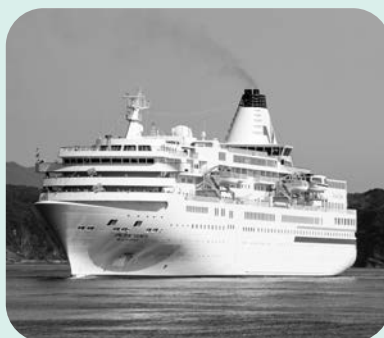
令和元年7月以来、3年ぶりの寄港

【ぱしふいっくびいなす】 ■日時 10月13日(木) ▼入港 午前11時 ▼出港 午後5時30分