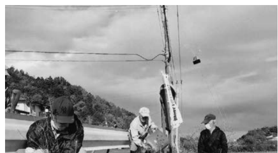
地域の環境美化と安全対策に活用されました(令和3年度地域力向上支援事業)