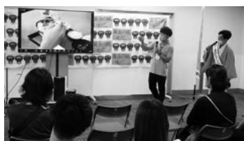
9月3日に東京で開催された移住相談会で、宮古市をPRしました！

このように声に 応えるべく宮古市 の魅力を伝え、移 住につながるきつ かけを作ります。 そのため、こ れから力を入れて