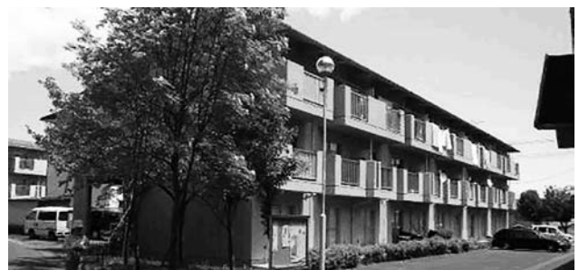
全住宅に駐車場を完備しています（写真は中里の住宅）