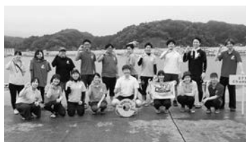
“カッターレース”に初めて参加。最高でした！（後列右から3番目）

私は、「ふるさと情報発信事業」をミツ ションに、U・Iターンを希望する人に 情報発信をしながら、盛岡や東京での移 住相談会などに参加してきました。 新型コロナウイルス感染症が流行する 中、都市部から地方に移住を希望する傾 向が強くなり、相談会では、「三陸鉄道に関わ る仕事がしたい」「宮古市出身でいつか は地元に戻りたい」といった、さまざま な移住相談を受けて います。