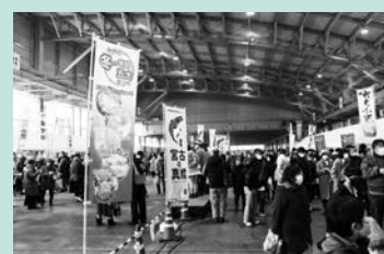
さまざまな商品を提供する出店が並びます(写真は令和3年度の様子)

■申し込み 宮古真鱈まつり実行委員会事務局（市水産課内、〒027-8501住所不要、☎68-9099、FAX 63-9116、 suisan@city.miyako.iwate.jp ）