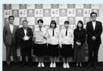
8月24日には、宮古市立第一中学校の生徒会から救援金をいただきました

■問い合わせ 日本赤十字社岩手県支部宮古市地区事務局(市生活課生活安全係内、☎68-9109)