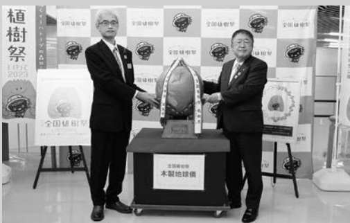
植樹祭の開催に向け、機運を高めていきましょう!

21世紀最初の植樹祭が開催された際「21世紀は地球環境の時代であり、森林・林業がさらに重要な役割を担う」ことをイメージして作られました。