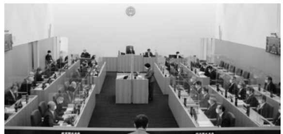
議会運営にあなたのご意見を!