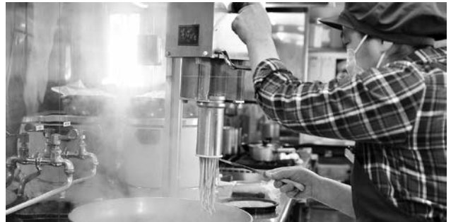
当日は、手で持てる小型の機械を使います