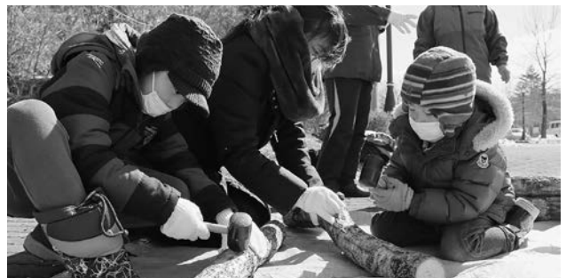
原木に穴を開け、固形状の菌をトンカチで打ち込みます