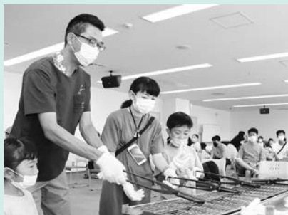
モノづくりの現場を体験してみませんか?