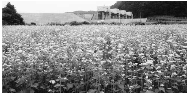
国道45号沿いのそば畑で栽培されています