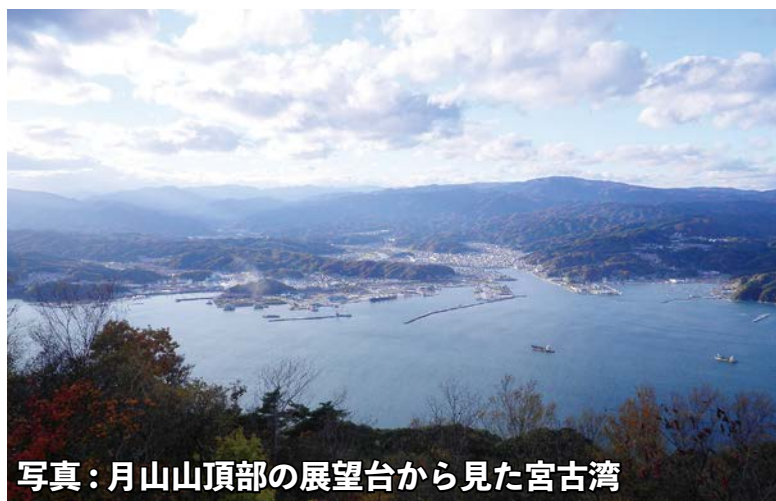
写真：月山山頂部の展望台から見た宮古湾

老朽化した展望所の再整備を行 い、市民やトレッキング愛好者の憩 いの場としての活用を図ります。