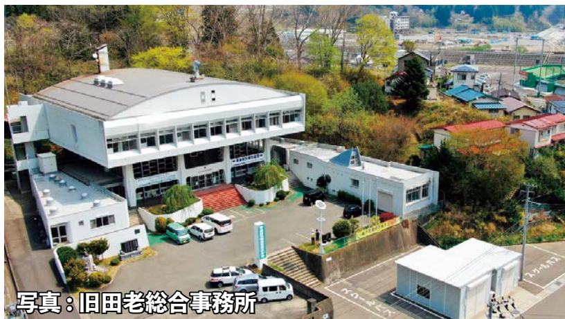
写真：旧田老総合事務所

解体後の跡地は、『「津波・歴史」 の学習、伝承施設』として活用す るため、整備に向けて実施設計を 行います。