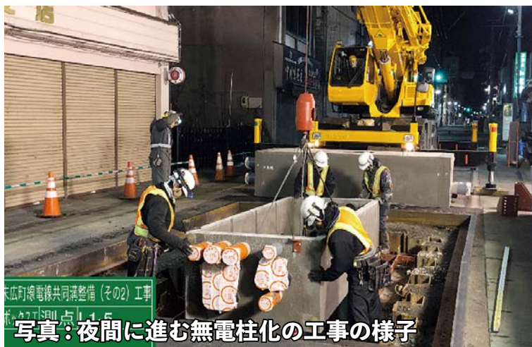
写真：夜間に進む無電柱化の工事の様子