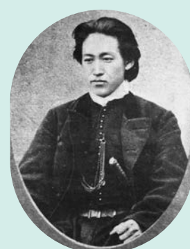
宮古港海戦に参戦した、土方歳三の肖像写真

宮古港海戦が繰り広げられた日を記念したツアーです。墓碑や記念碑を巡り、遊覧船「宮古うみねこ丸」に乗って海戦の歴史を学びます。