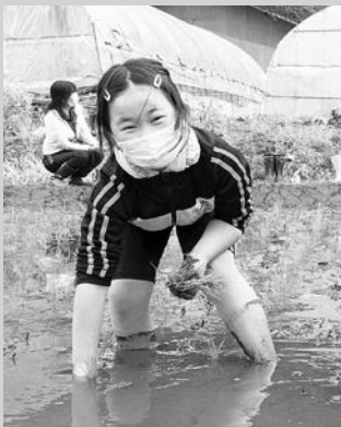
皆で泥んこになりながら、楽しく植えましょう!