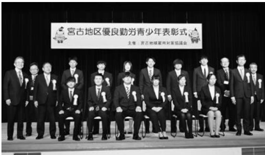
4月20日に行われた表彰式