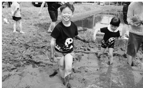
宮古の農業まるごと体験「田植え」