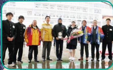
「シルバー・ウィスパー」の歓迎セレモニーでは、記念盾などを船長らに贈呈