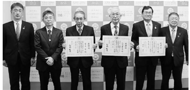
3人のご活躍に敬意を表します。お疲れ様でした