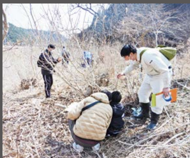
産卵地観察会の様子

今年も6月に成虫観察会、来年3月に産卵地観察会を開催する予定です。豊かな「里山」の象徴ともいえるチョウセンアカシジミの現状を、肌で感じることで、自然との共生について考えてみてはいかがでしょうか。