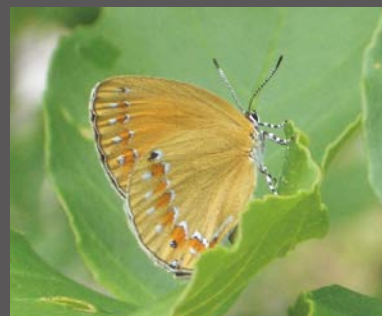
チョウセンアカシジミの成虫