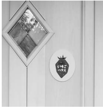
今年度から新たに開所した家庭的保育事業所のいちごハウス。 ドアに貼られたイチゴマークが目印です！ぜひご利用ください