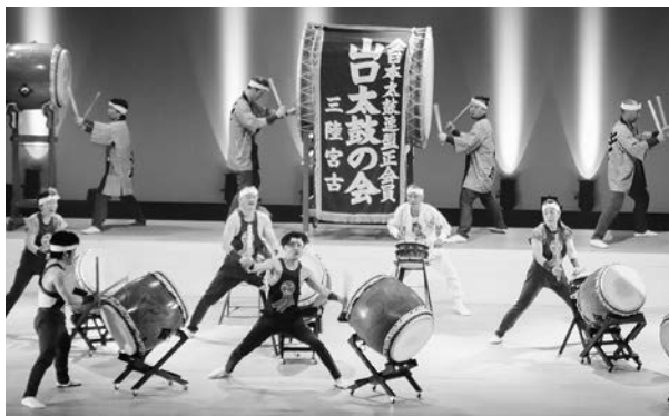
三陸太鼓フェスティバル2023