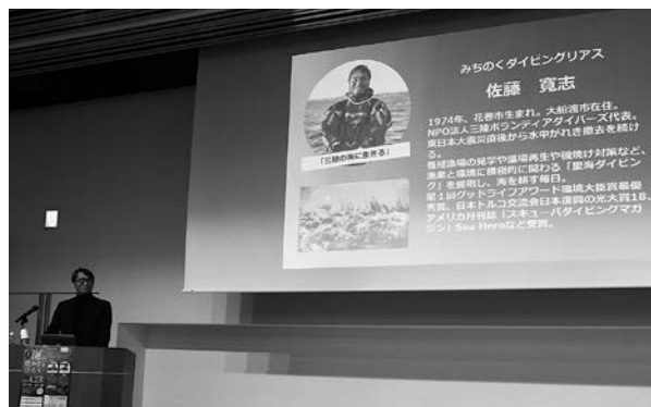
講演『海の豊かさを守ろう』