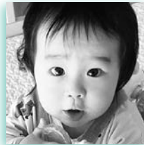
そうへい 関 蒼平ちゃん 今月で1歳です 蒼ちゃんの笑顔に家族みんなが癒されているよ。これからもお兄ちゃんとして仲良く、すくすく元気に育ってね。誕生日おめでとう! (家族)

写真に、子どもの名前・ふりがな・生年月日・郵便番号・住所・電話番号・メッセージ(40字程度)を書いたメモを添えて、市企画課(市役所4階)にお届けください。郵送の場合は、〒027-8501住所不要、宮古市役所「広報みやこ」係へ。メールの場合は「✉info@city.miyako.iwate.jp」まで。7月生まれの子どもの写真は、6月7日(休)必着をお願いします。