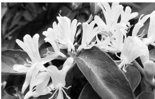
きれいな花を咲かせるハナヒョウタンボク