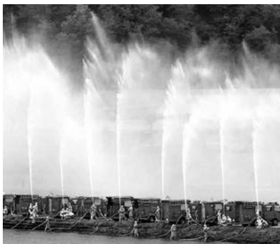
大迫力の放水をご覧ください

宮古消防署(☎62-5533)、田老分署(☎87-2545)、新里分署(☎72-2011)、川井分署(☎76-2110)