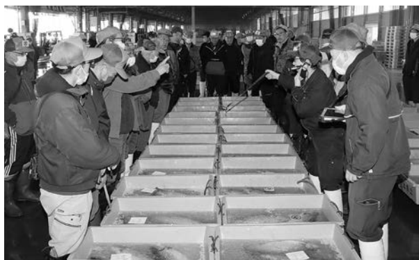
第4期“宮古トラウトサーモン”初出荷