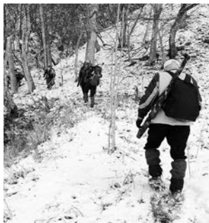
雪深い山の中を地道に歩きながら、獲物を探します

は「勢子」と呼ばれる獲物を追い立てるグループと「立ち」と呼ばれる追い立てられた獲物を射止めるグループに分かれて猟をします。私は「立ち」として参加させて