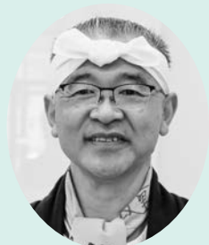
三陸太鼓フェスティバルに参加した気仙沼太鼓連合「和」の幹事長

A. 今回のように大鼓を通して、これからも交流を続けていきたいです。毎年8月に開催される気仙沼みなとまつりで、迫力のある大鼓の演奏（打ちばやし大競演）を行いますので、ぜひお越しください！