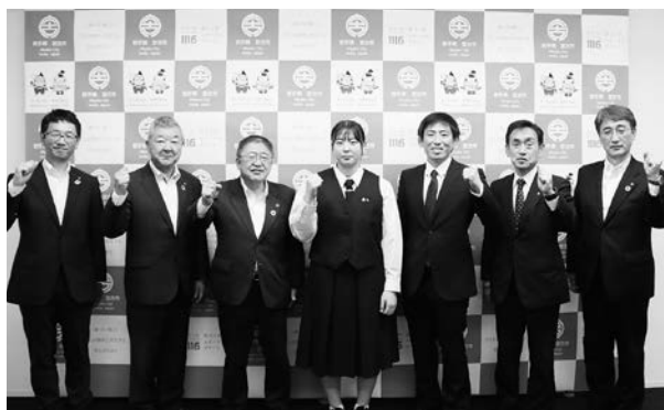
2023年U17アジアレスリング選手権大会 出場に伴う市長表敬