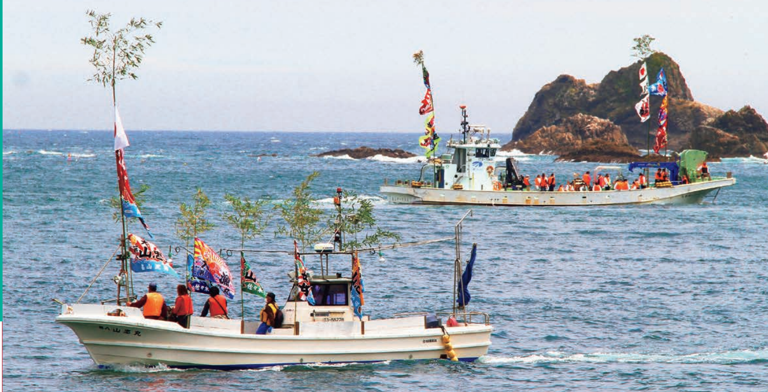
田老漁港から引き船が出港。色とりどりの大漁旗をはためかせながら湾内を周回し、海の安全と大漁を祈願しました