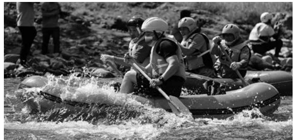
閉伊川の大自然を満喫しましょう!(写真は令和4年実施の様子)

【共通】 ■問い合わせ 閉伊川遊イング事業実行委員会事務局(新里総合事務所内、☎72-2111)