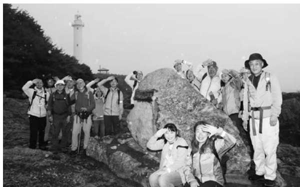
Sunrise Trail ～本州最東端「鮭ヶ崎」トレッキング～