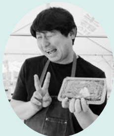
浄土ヶ浜 夜空の ビールフェスタに 参加した 有限会社レストラン 御幸・代表取締役

A. 宮古は“第2のふるさと”です!これからも末永くこの関係を続けていきたいので、皆さんよろしくお願いします。黒石市にもぜひ足を運んでくださいね!お待ちしております!