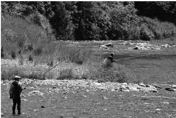
天然鮎の友釣りを楽しみましょう!(写真は令和4年実施の様子)