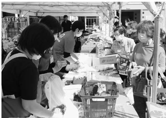
皆さまのご来場をお待ちしております

宮古市産業まつり実行委員会事務局(市産業支援センター内、〒027-8501住所不要、☎68-9092、FAX63-9120)