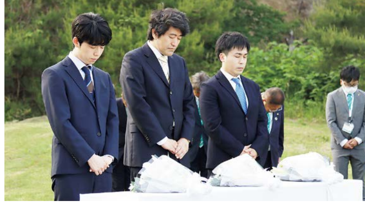
藤井叡王と菅井八段は、対局前日の27日に宮古入り。浄土ヶ浜を訪れ、東日本大震災の犠牲者へ献花と黙とうを捧げました