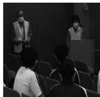
真剣に話を聞いていました