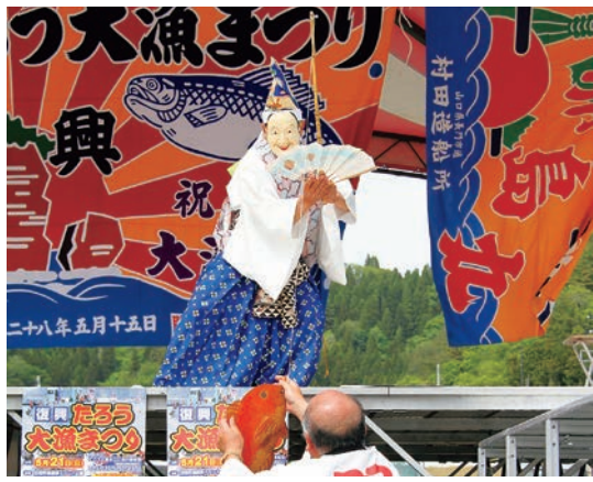
タイを釣る場面は、恵比寿舞の見所の一つ。息の合ったかけ合いに、会場からは拍手が起きていました