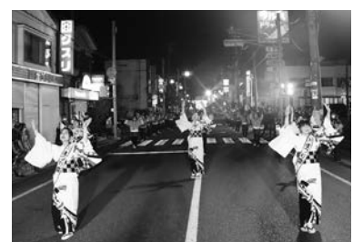
秋まつりを一緒に楽しみましょう

みやこ秋まつり実行委員会・小笠原(☎090-1378-0033、✉miyakoakimatsuri@gmail.com)