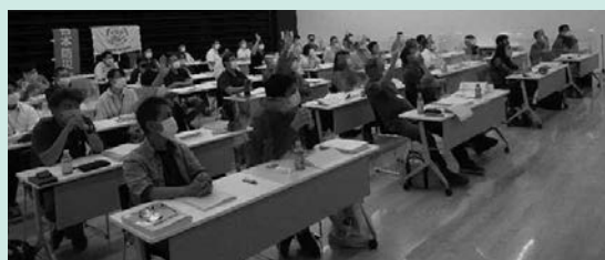
昨年開催された講座の様子