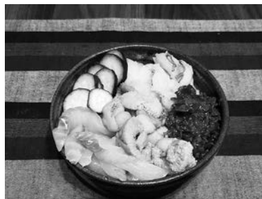
早速、海鮮丼を自作しました！

行き先を探すに当たって、日本各地を飛び回りました。少子化や東京への一極集中を考えれば当然ですが、どの地方も、少なからず衰退・過疎化が進行していて、こうした状況を解決する一手は容易に見つかりそうにはありません。しかし、だからこそ地域おこしをお手伝いする仕事には意味があると思います。宮古市は、私にとっ