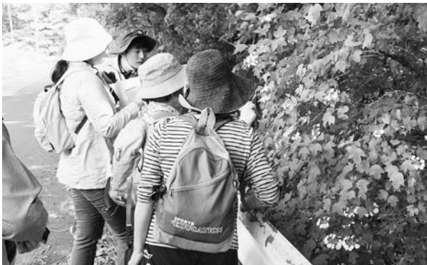
ハナヒョウタンボクの群落 ～日本一のハナヒョウタンボク観察会～