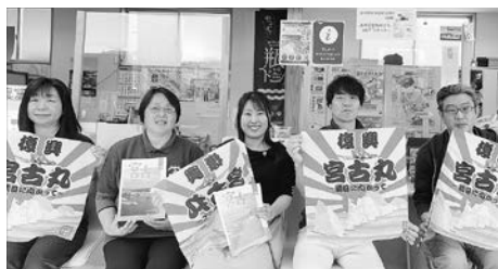
主に、駅前の観光案内所で勤務しています！

同時に、大きな困難を乗り越えた宮古市を伝え広めることは、災害が絶えない日本の人々に大きな希望を与える一つの方法だと感じました。そして、これが私の使命なのだ。このたび、地域おこし協力隊として、宮古市の