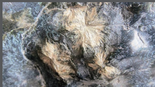
「小国の菊寿石（頑火輝石）」（宮古市川井総合事務所蔵）北上山地民俗資料館ロビーで展示中

国の「菊寿石」のような放射状の頑火輝石は全国的に珍しく、小国地区は国内最大の産地でした。1970（昭和45）年ころから採掘されていましたが、現在では採掘されていないために数が少なく、今でも貴重な品として出回っています。当館ロビーでは、昨年度に開催したミニ企画展「みやこの鉱物」で「菊寿石」を展示しましたが、現在も継続して展示していますので是非ご覧ください。