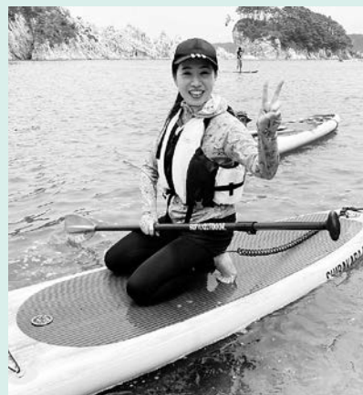
浄土ヶ浜の景色を眺めながら、気軽に楽しみましょう！

■問い合わせ 森・川・海体験交流事業実行委員会(市観光課内、☎9091) ■申し込み方法 下記QRコードから申し込み ■申込受付開始日 7月1日(土)午前10時 ■参加料 無料 ■用意する物 濡れてもよい服装(救命胴衣は用意します) ■対象 小学生以上 ■定員 両日、各回8人(1クール30分) ■日時 ①午前10時②10時45分③11時30分④午後1時⑤1時45分 ■場所 砥石浜付近(浄土ヶ浜園地内) ■講師 ムラサキスポーツイオンモール盛岡南店スタッフ