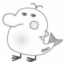
市の地域脱炭素キャラクター「デカボン」