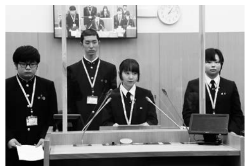
活発な議論が交わされた昨年の未来議会