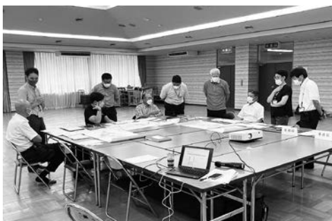
8月に実施した、第1回地域説明会の様子。第2回は、12月を予定しています