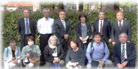
(岩手県内各少年センター参加者)