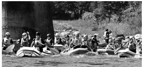
閉伊川の大自然を満喫しよう！（写真は令和4年の様子）

【共通】☎ 閉伊川遊イング事業実行委員会事務局（新里総合事務所内、☎72-2111）