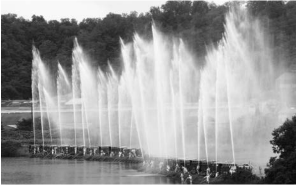
令和6年度宮古市消防団大演習