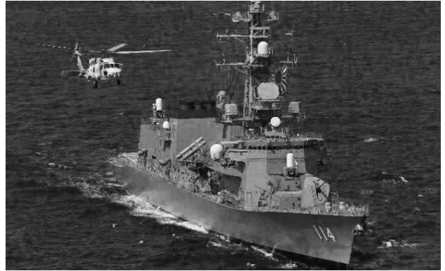
市民の皆さんの歓迎をおねがいします

☎ 市危機管理課防災係（☎68-9111）、自衛隊岩手地方協力本部宮古地域事務所（☎63-3881）