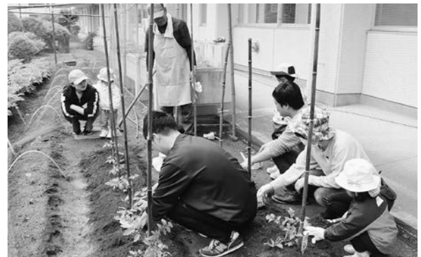
乳幼児期家庭教育学級「第1回めばえ」 ～親子で体験・ミニトマトの苗植え～