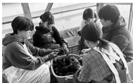
東京の学生が我が家で漁業体験！

定住に向けた話になります。が、昨年の冬に、かねてからの夢であった漁家民泊を重茂でオープンしました。宿泊されたお客様はミュージシャン、大学の教授など今まで出会ったことがない方々ばかり。新鮮な出会いに話が弾み、毎晩、楽しい時間を過ごしています。