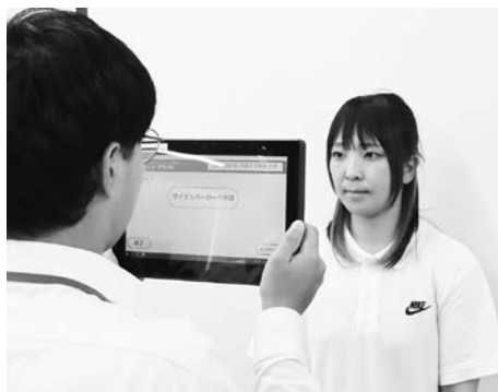
専用の機械で写真を撮影します