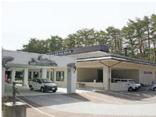
▲岩手県立水産科学館