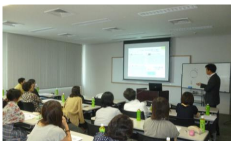
視聴覚（OA）室 (講習・研修会、説明会など)