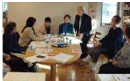
貸室（研修会議室） (研修会議、団体活動など)