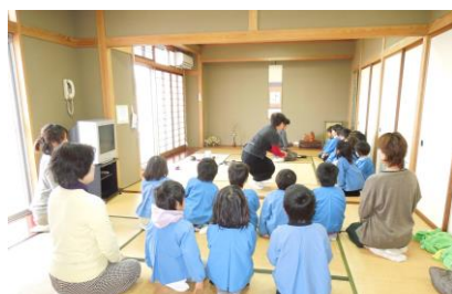
和室 (教室、会議、着付など)