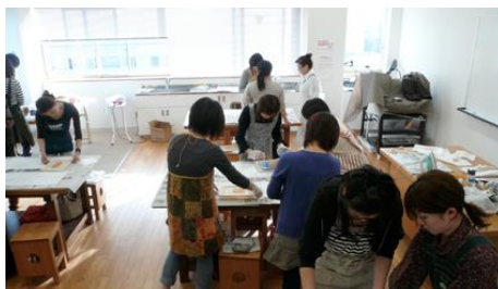
創作活動室 (教室、体験、展示など)