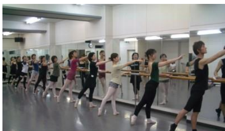
軽運動スタジオ (ダンス舞踊、健康運動など)