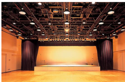
多目的ホール (発表会、講演会、総会など)