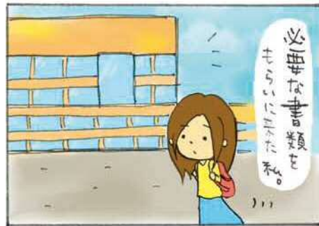
暇つぶしのはずが…