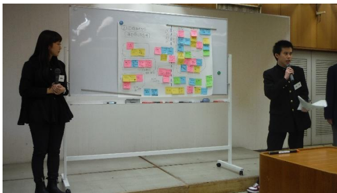
(2)広場あそび系グループ 海を感じる広場に、幅広い世代が“春夏秋冬”楽しめるようにしたい