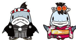
サケのまち宮古PRキャラクター サーモンくん&みよこちゃん

宮古市では、現在、宮古駅南側に、市民交流センター(仮称)、市本庁舎、保健センターの3つの機能を集約した「地域防災拠点施設」の整備を進めています。