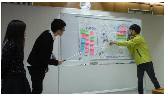
(1)スポーツ系グループ 年齢を問わず、だれにでもできるスポーツを更衣室やシャワー室も必要では