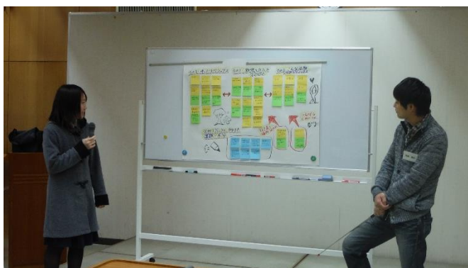
(5)くつろぎ(リラックス)系グループ ゆったりリラックス、勉強やカフェでリラックス、活動しながらリラックス

各グループからの発表の後、弘前大学の北原先生からは、以下のようなコメントをいただき、今回のワークショップは終了しました。