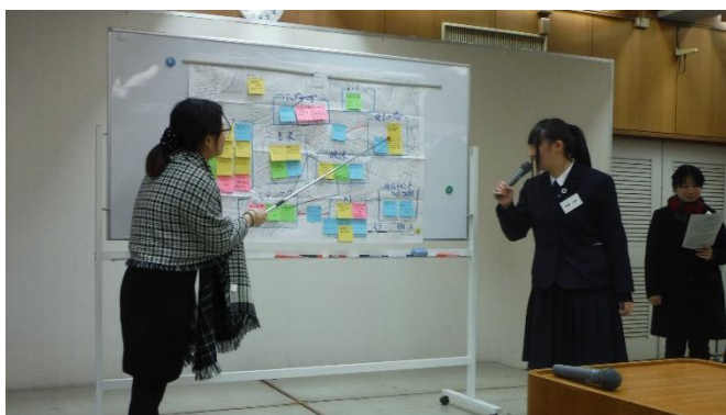
(3)ステージ系グループ 市民の発表の場として、既存イベントへの活用も川を活かすステージ構成ができないか？