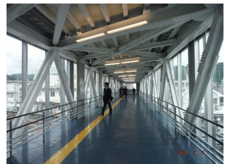
クロスデッキ(自由通路)