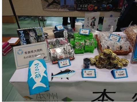
本州最北端：青森県大間町ブース

♪珍味♪ ふくにあぶり焼き、ふくの骨せんべい、うつぼ揚げ煮、ポンカンジャム、マグロ筋ブッセ、とろろ昆布スープなど