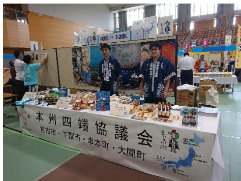
本州四端協議会ブース