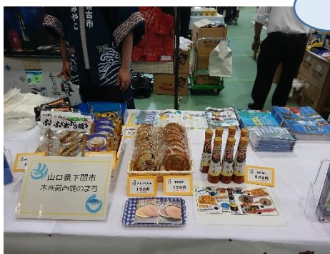
本州最西端：山口県下関市ブース