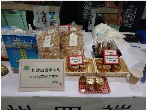
本州最南端：和歌山県串本町ブース