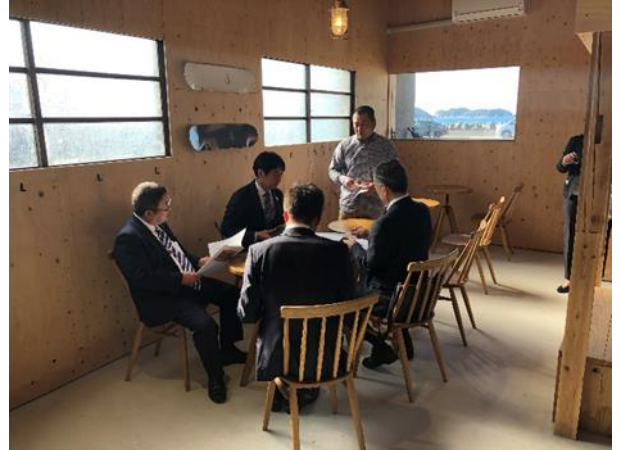
• 小串のまちづくりの説明を受ける4首長