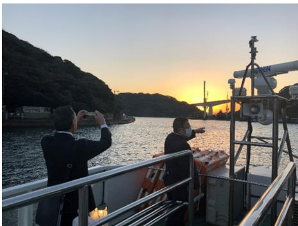
• 船上から市内視察