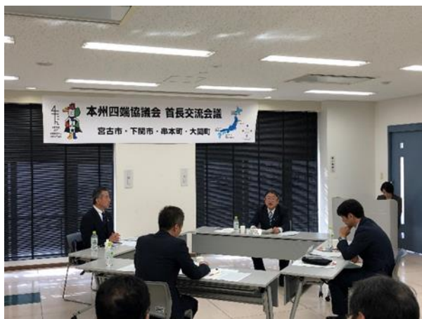
・これまでと今後の事業を話し合う4首長