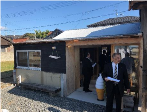
• 小串のまちづくりを見学