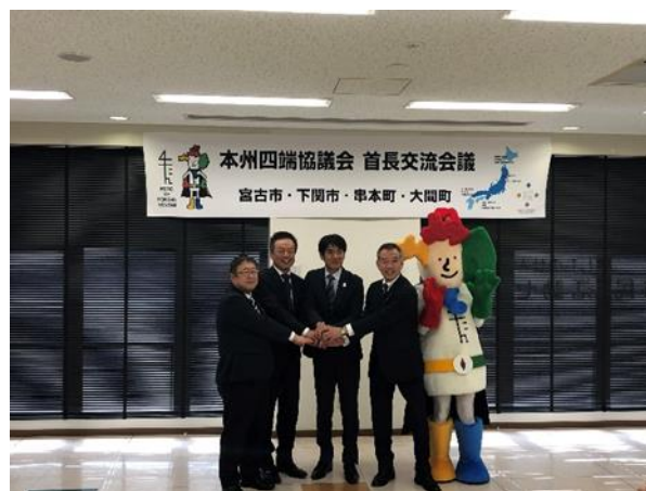
・よんたんと一緒に手を取り合う4首長