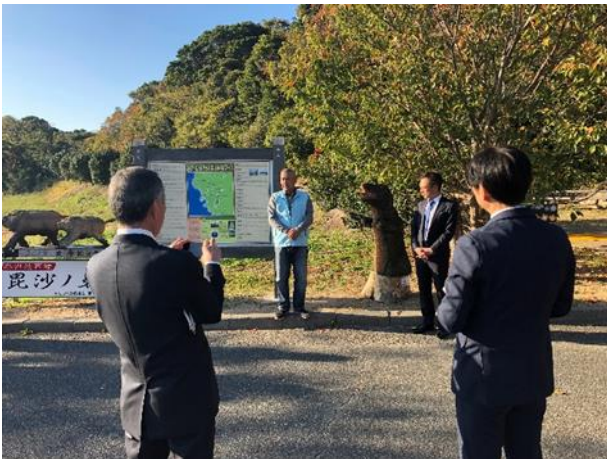
• 吉母のまちづくりの説明を受ける4首長