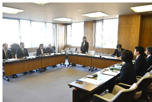
松本市での行政視察の様子

市内の地域コミュニティとして、小中学校区より多い行政区35地区において、地域づくりセンターを設置。同センターでは、公民館、支所・出張所、福祉ひろばがセットになっています。この地域づくりシステムには、各種団体、町会、行政、NPO、大学、企業が連携しているほか、地域包括ケアシステムにも取り組んでいます。