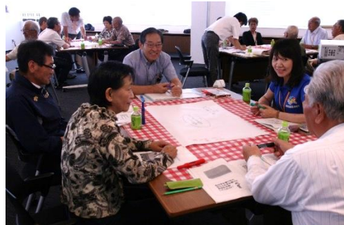
ワークショップの様子①