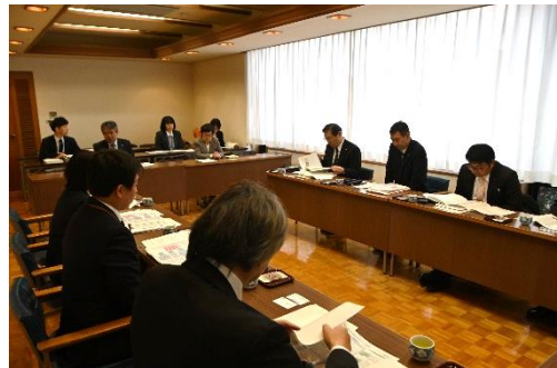
佐久市での視察の様子

佐久市では「世界最高健康都市の構築」を重要施策の一つとして位置付け、体系的かつ効果的に施策を推進するために、「世界最高健康都市構想」と「世界最高健康都市構想実現プラン」を策定しています。このプランは、「健康の協奏～みんなで奏でる健康のシンフォニー～」をテーマに、「ひとの健康づくり」「まちの健康づくり」「きずなの健康づくり」「広がる健康づくり」という4つの基本方針から構成されています。