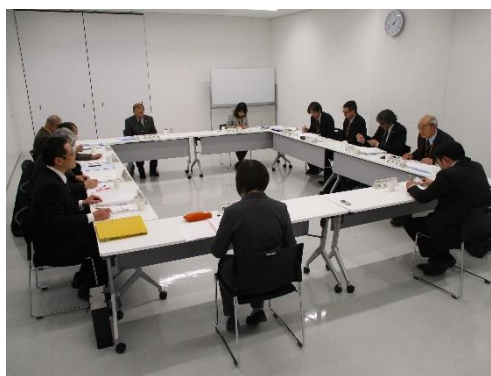
社会福祉協議会との意見交換の様子

健康寿命の延伸については「老人デイサービスにおける高齢者の健康管理」として、高齢者が対象となる社協の事業における、健康管理の留意点や、現場で感じている課題などを説明していただき、意見交換を行うことができました。