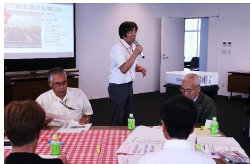
ワークショップの様子②