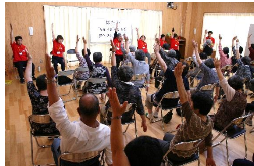
にこにこ体操教室の様子

シルリハおらんどの会の指導により、リハビリテーションをもとに考案された体操を見学・体験しました。そのあと3組に分かれて「いつまでも『いきいき健康に暮らせる』まちづくりとは」のテーマに沿って、参加者の声を聞き取りました。ワークショップ形式で聞き取った参加者からの意見は、その場で模造紙に書き留め、これを用いて後日、検討と課題抽出を行いました。