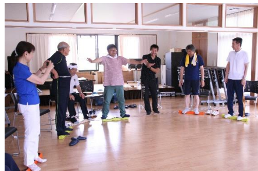
エムジョイでの体操の様子

エムジョイによるボール等を使った体操、脳をトレーニングするゲームなどを見学・体験しました。そのあと3組に分かれて「いつまでも『いきいき健康に暮らせる』まちづくりとは」のテーマに沿って、参加者の声を聞き取りました。