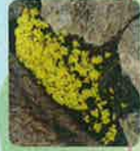
ナンブイヌナスナ (6月上旬～7月中旬)