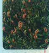
ナンブトウチソウ (7月下旬～9月下旬)