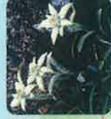
ハヤチネウスユキソウ (6月中旬～8月上旬)