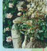
ナンブトラノオ (7月中旬～9月中旬)