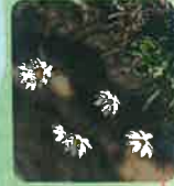
ヒメコザクラ (5月下旬～6月下旬)