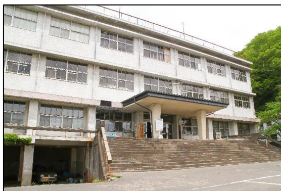
左：本庁舎(本館) (昭和47年竣工) 右：分庁舎 (昭和37年竣工)