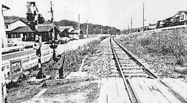
新駅「八木沢・宮古短大」建設場所と竹洞踏切