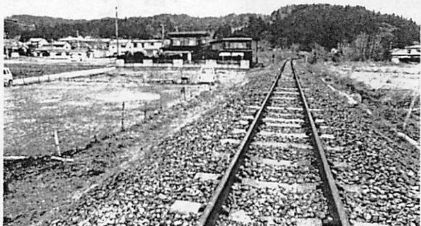
新駅「払川」建設場所(平成30年建設)