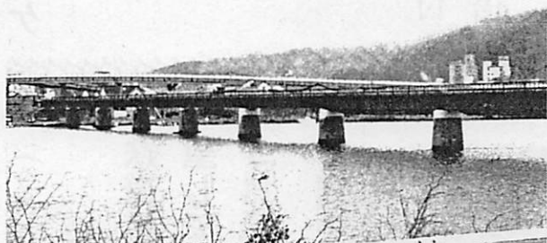
復旧した閉伊川鉄橋