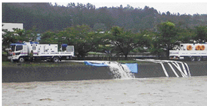
引用元 国土交通省東北地方整備局岩手河川国道事務所