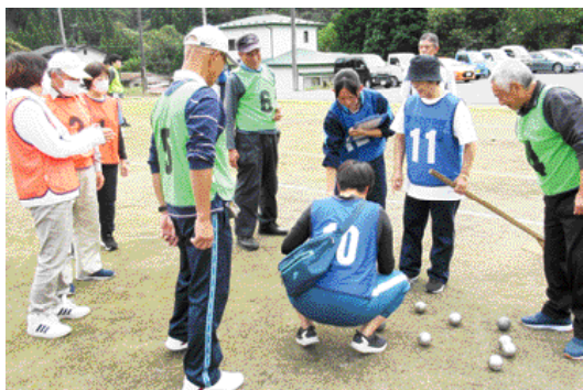
多世代交流が地域の元気の源に！