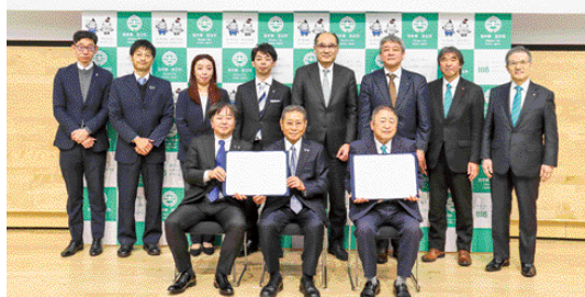
新たに誘致企業となったカネ弥株