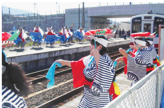
地域を盛り上げる活動を後押しします！