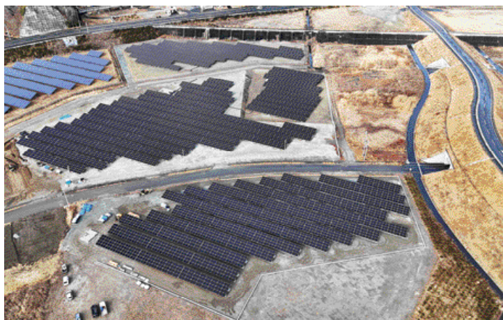
田老地区に整備中の夜間連系太陽光発電所