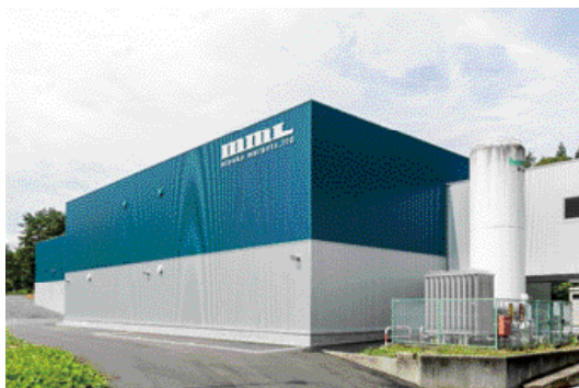
工場を増設した株宮古マランツ