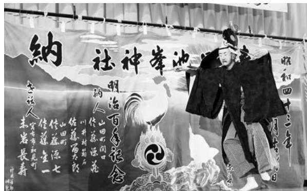
第51回川井郷土芸能祭

心頭内では特産品などの販売コーナーが設けられ、夜には海上打上花火が行われました。