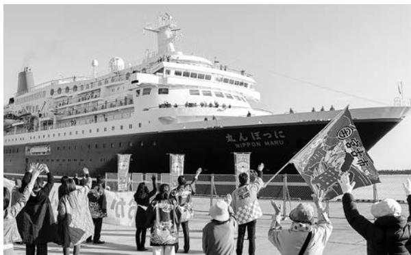
客船「にっぽん丸」寄港